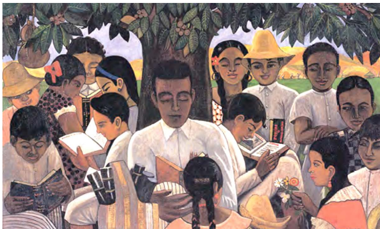
Figura 2. Escuela bajo el amate (1939, 1943), Luis Alfredo Cáceres.

Fuente: “Arte salvadoreño. Cronología de las artes visuales de El Salvador. Tomo I: 1821-1949”, Jorge Palomo (San Salvador: MARTE, 2017: 227).