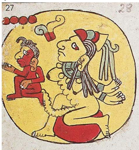
Figura 5. En el escudo que se hinchó de una masa... vio el día llamando a la guerra (Primeros memoriales, 276r), es decir, envuelto de la placenta roja como la sangre y la lava, atado a la Matria, inicia la vida misma.