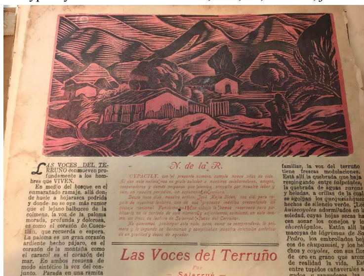
Figura 3. “Cypactly. Revista de Variedades”, Año, IX, No. 151, julio 25 de 1940.

hay una renuncia. El poeta abandona la ciudad, en un primer momento, y cuando opta luego por regresar ya no se identifica con el entorno social de origen. Entonces, deambula solitario en los barrios bajos. El escritor es un desclasado, tanto con respecto a la ciudad, así como con el mundo burgués y moderno naciente, del cual proviene. Sin llegar a un radicalismo político y aún de manera incipiente, Miranda Ruano nos ofrece una de las propuestas pioneras por vincular la poesía y el rescate de la voz popular marginada. Su verdadero radicalismo existencial culmina en el suicidio.