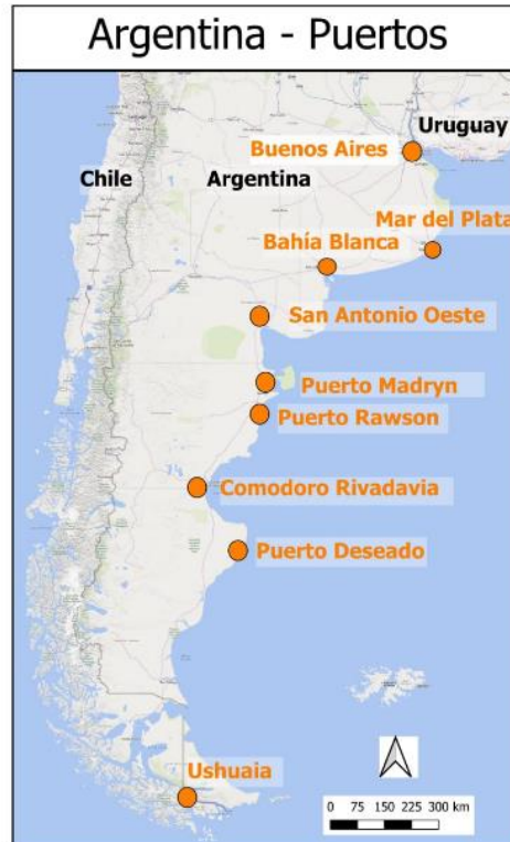
Mapa 1: Ubicación de Puerto Rawson en el sistema portuario del litoral atlántico argentino

Hacia mediados de la década del '40 del siglo XX comenzó a estructurarse una actividad pesquera con características industriales, con asiento fundamental en Puerto Rawson. Aquí se registra la transformación generada por la dinamización de esta rama económica, a partir de la demanda del aceite vitamínico provisto por el hígado de cazón y luego sostenido por la captura de langostinos y otras especies. La actividad pesquera comenzó a descentrarse de la costa bonaerense, iniciando la explotación del recurso desde puertos patagónicos: esta historia es reconstruida aquí desde medios de prensa regionales, relevamiento bibliográfico y otras fuentes. Se analizaron los semanarios El Pueblo (de 1940 a 1953, cuando dejó de editarse; publicado en Trelew), Avisador Comercial (desde 1944 a 1948, cuando dejó de editarse; de Trelew), El Progreso (ediciones varias desde 1939 a 1948; de Trelew), El Regional (ediciones varias hasta 1961; de Gaiman), La Voz del Sur (ediciones de 1952; de Rawson), La Cruz del Sur (ediciones de 1942 a 1949; de Rawson) y el diario Jornada (primer diario de la región, relevado desde 1954 hasta mediados de los '60s; de Trelew).