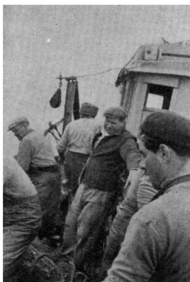
Imagen 3: Marineros trabajando, Cordini, 1963: 37.

Reseña una ocupación de marineros en la pesca en torno a las 200 personas (todos varones) durante los últimos años, y trece fábricas instaladas en Rawson (de las cuáles once tenían producción actual), con apenas once trabajadores permanentes (también solamente varones) y 250 temporarias, de las cuales más del 70% eran mujeres y “cuyo jornal es algo menor que el de los hombres” (Cordini, 1963: 28).