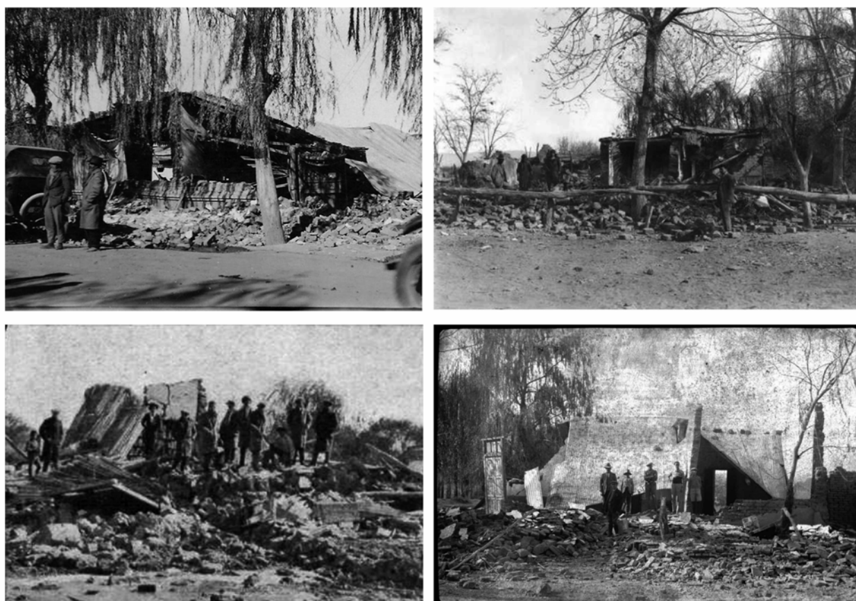
FIGURA 7. Fotografías de las ruinas que atestiguan la magnitud del acontecimiento en Villa Atuel