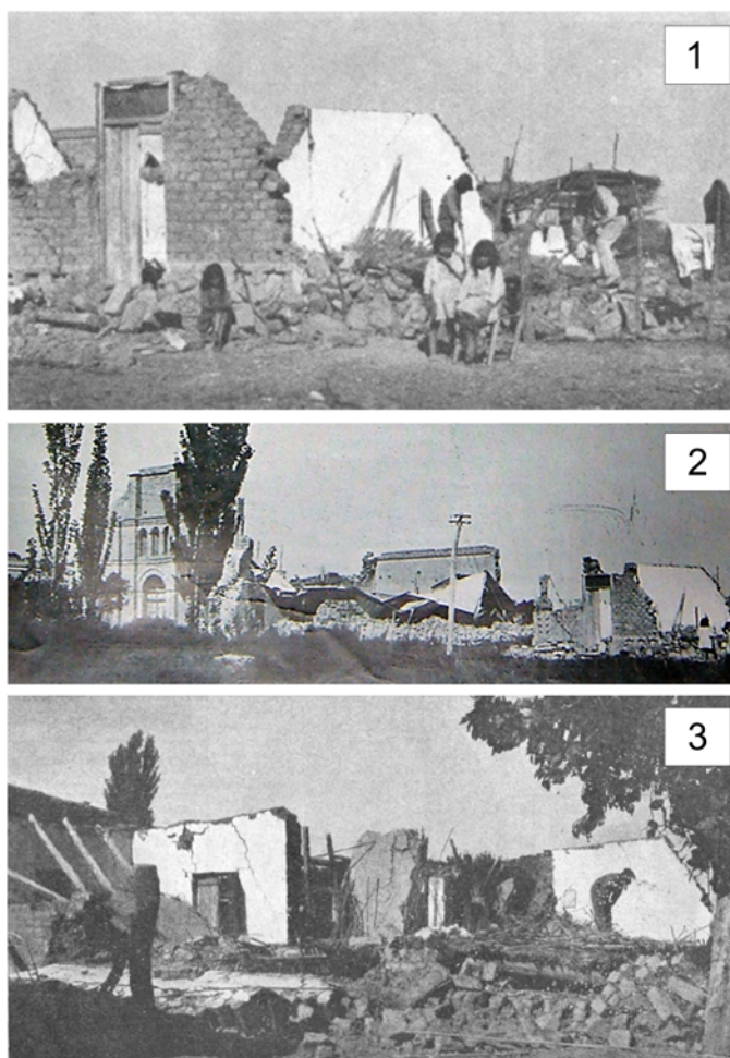
FIGURA 4. Fotografías de la prensa local: 1. Niños sin hogar entre los escombros; 2- Destrucción de la iglesia de Lavalle; 3. Destrozos del temblor