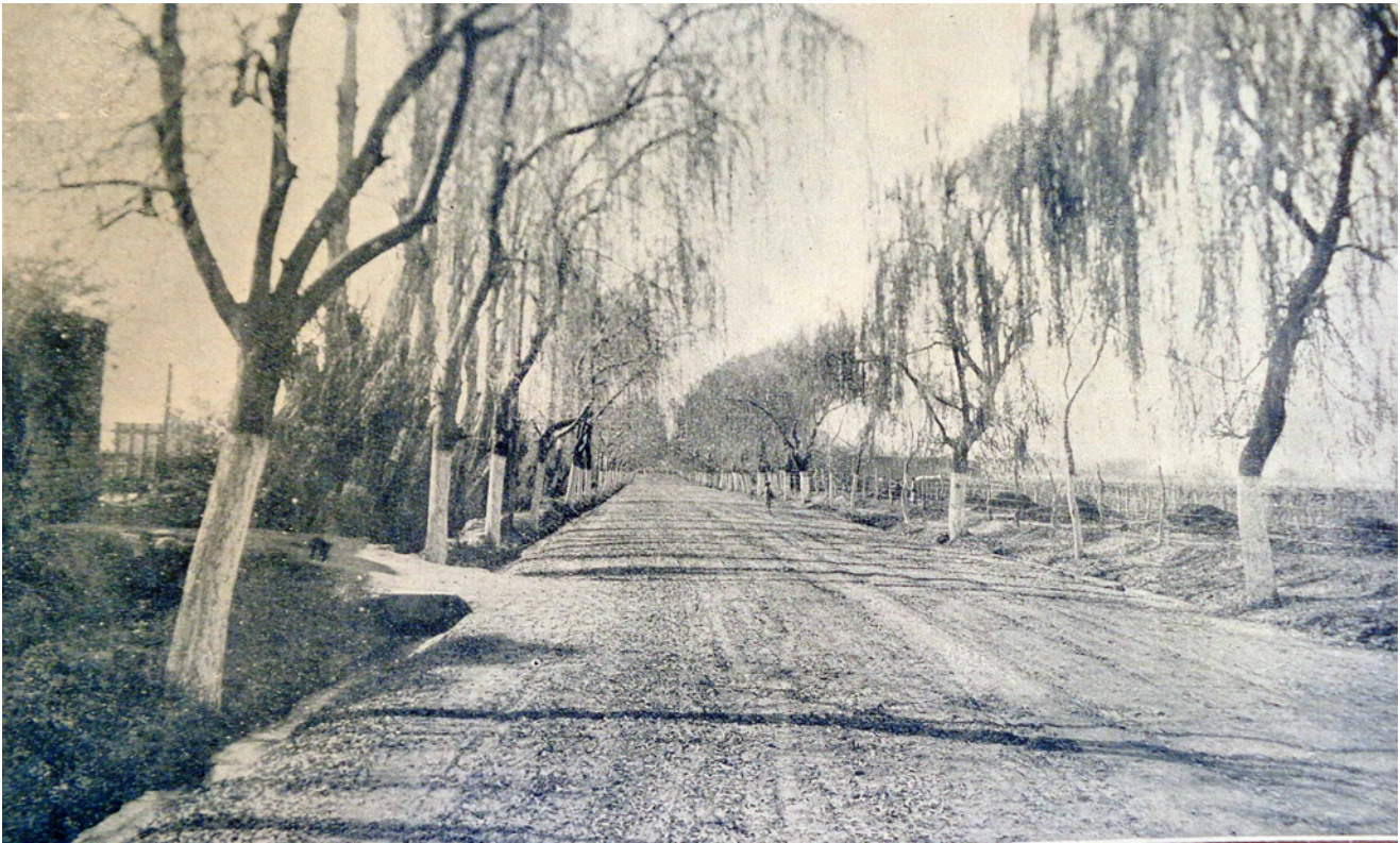
FIGURA 6. Camino a Lavalle, reconstruido en 1923