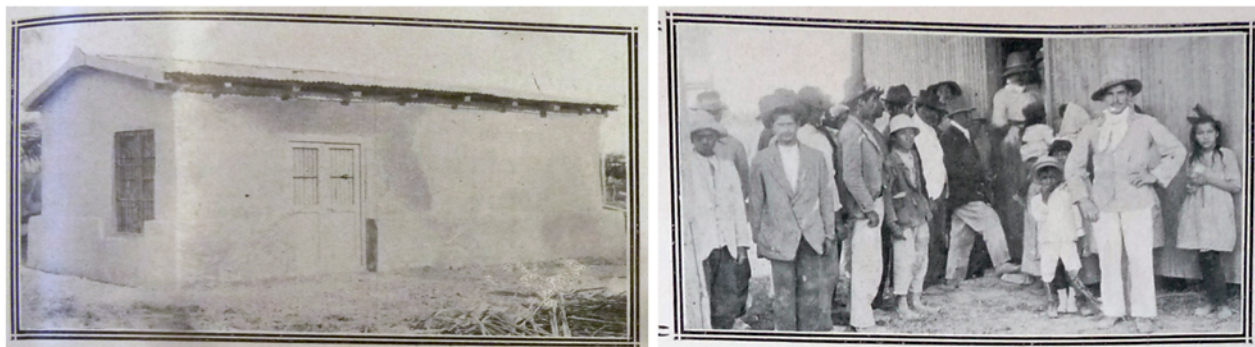
FIGURA 5. Fotografías de la prensa donde se muestra una vivienda de dimensiones mínimas (izq.) y comercio construido con materiales de rápido ensamblado (der.)