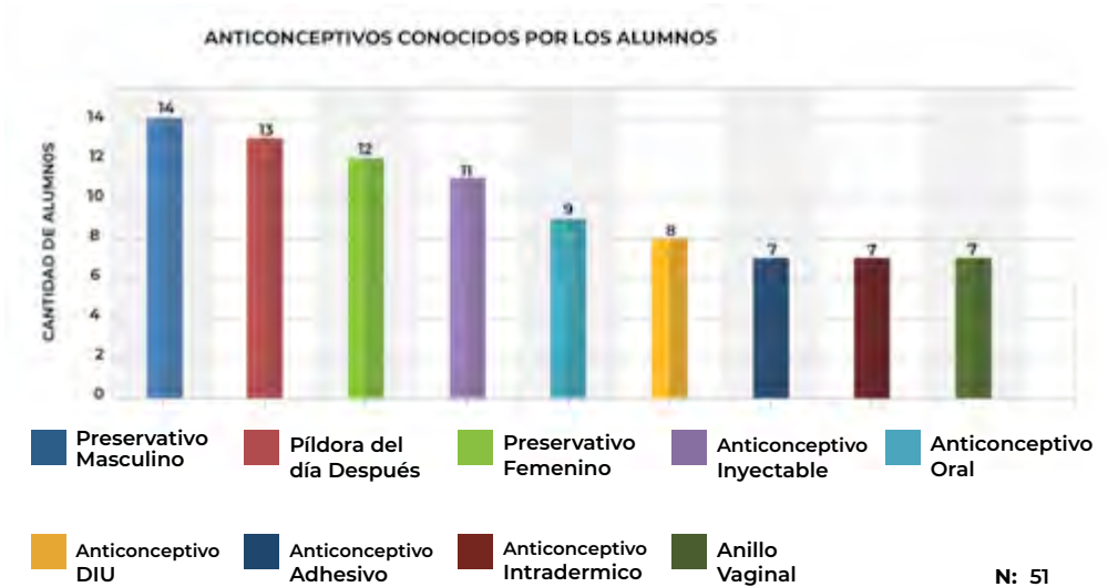
Gráfico 4. Anticonceptivos conocidos por los alumnos.

La mayoría de ellos alumnos señalaron que conocían el preservativo masculino, en segundo lugar, el anticonceptivo oral y en tercer lugar el anticonceptivo píldora.