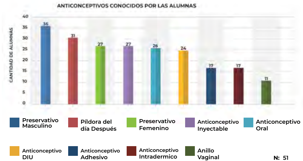
Gráfico 3. Anticonceptivos conocidos por las alumnas.