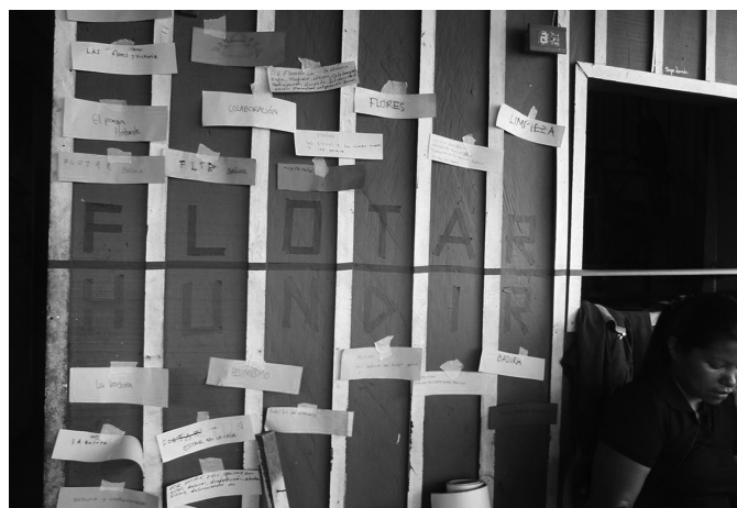
Figura 4_ Docentes y alumnos del Taller Matéricos Periféricos construyendo en un barrio industrial de Santa Fe (Argentina).