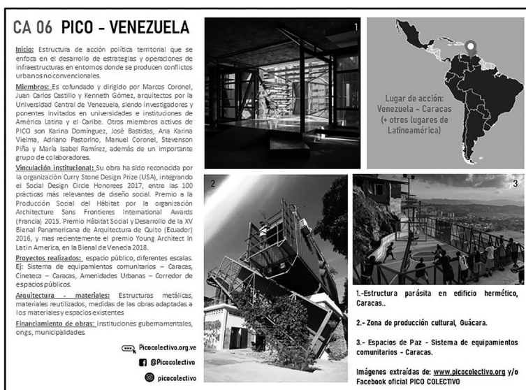
Figura 1_ Ficha por colectivo: Ejemplo Pico Colectivo. Fuente: elaboración propia en conjunto con la Dra. Arq. Bibiana Cicutti. Imágenes extraídas de www.picoactivo.org y/o Facebook oficial Pico Colectivo.

Una vez detectada una gran cantidad de colectivos, hubo una primera selección intencionada que atendió a sus márgenes de impacto a escala local y la representatividad de escala latinoamericana. En esta primera selección