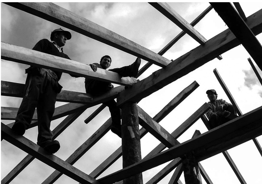
Figura 5_ Miembros de la comunidad de leñadores de Pinohuacho (Chile), construyendo junto al Grupo Talca el Quincho Gorro Capucha.

Es importante destacar que, a lo largo de la investigación, se han detectado coincidencias en el trabajo de los colectivos de arquitectura que permiten extraer constantes para su estudio y que abren interrogantes hacia nuevas puntas de investigación. Estas se relacionan con sus prácticas cooperativas con asociaciones civiles, gobiernos y comunidades. También se involucran tanto en el proceso proyectual como en la gestión y organización de los recursos para construir las obras, al generar un importante grado de apropiación por parte de la población en la mayoría de los casos trabajados, lo que permite que las obras realizadas se conviertan en enclaves importantes para las comunidades y que