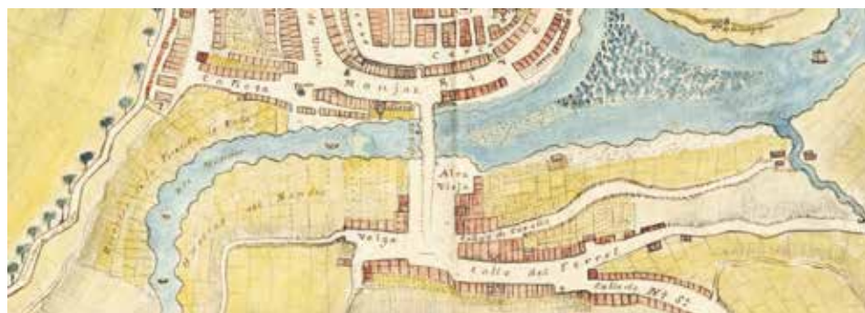
FIG.11. MARTÍNEZ SANTISO, F. J. (1877). Detalle do barrio do Mandeo no Plano de la ciudad de Betanzos . Arquivo Municipal de Betanzos.