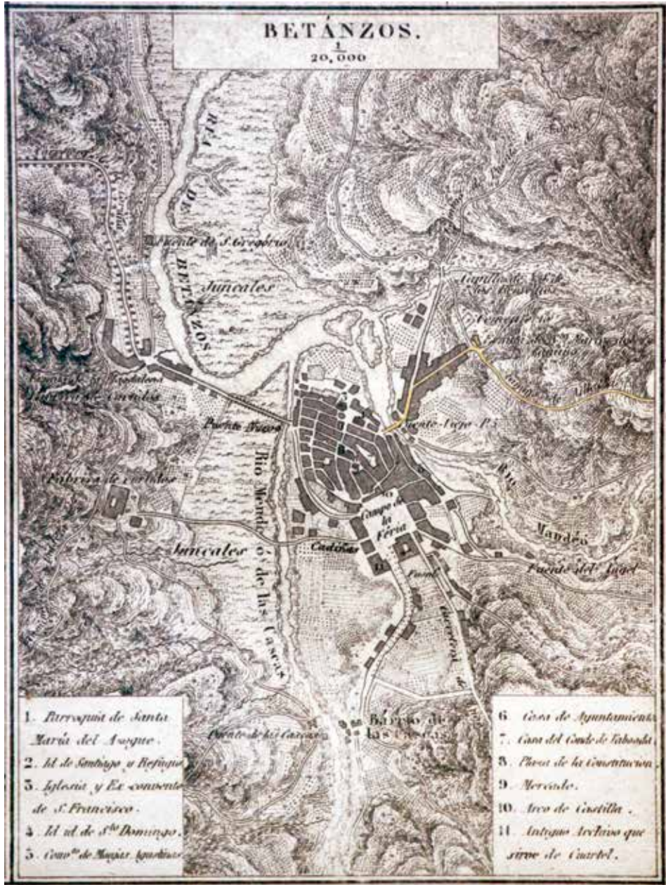
FIG.03. MADRIZ, P. (c.1845). Plano de Betanzos. Diccionario Geográfico Estadístico Histórico de España y sus posesiones de Ultramar.

Os seguintes no tempo xa serían os deseñados por Francisco Javier Martínez Santiso en torno a 1890 e outro realizado na primeira década do século XX. O máis antigo non conta con ningún tipo de escala, é un debuxo sinxelo e moi esquemático onde