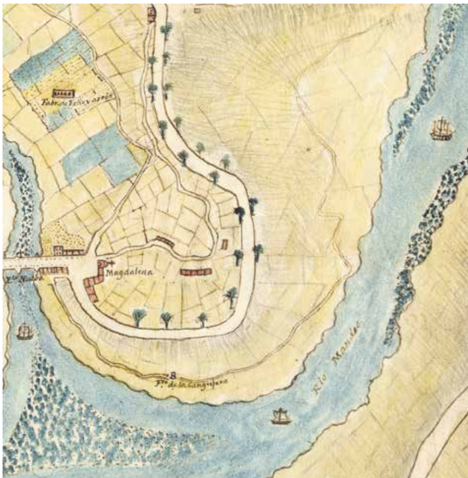
FIG.10. MARTÍNEZ SANTISO, F. J. (1877). Detalle do barrio da Magdalena no Plano de la ciudad de Betanzos . Arquivo Municipal de Betanzos.