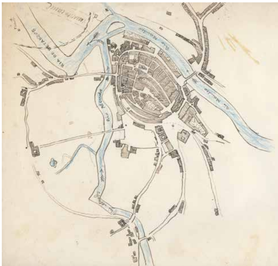
FIG.04. MARTÍNEZ SANTISO, F. J. (c.1890). Plano de Betanzos . Arquivo Municipal de Betanzos.

aparecen representados os ríos Mendo e Mandeo, a ría de Betanzos e as súas variacións de caudal, pero sen ningunha lenda a maiores, simplemente ca representación das casas e barrios a través dunha vista aérea que permite facilmente adiviñar cada unha das zonas de Betanzos. Chama tamén a nosa atención a representación que fai das fábricas de curtidos da Magdalena e do Carregal incorporando un novo corpo na zona do Carregal e que pola forma parece corresponder co Estanque dos Papas do Parque do Pasatempo, conectado co río Mendo por medio dunha lingua de auga que abastecería aos estanques da parte baixa do xardín dos García Naveira.