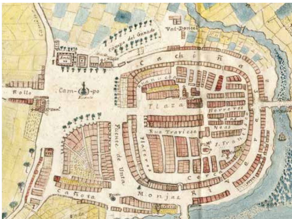
FIG.12. MARTÍNEZ SANTISO, F. J. (1877). Detalle do casco histórico no Plano de la ciudad de Betanzos . Arquivo Municipal de Betanzos.

Achegándonos máis á antiga muralla da cidade aparecen outras rúas e outros lugares indicados, como son a Fonte de Unta , a Cañota e o que o artista chama Monjas . Estas tres rúas conectábanse nunha fonte exenta que semella ser a do Pozo, xa que a coñecida como do Picho Carolo aparece tamén representada contra as casas do lado da muralla. Entre a Ponte Vella e a Ponte Nova aparecen tamén dúas indicacións, a da Rivera , que sería a rúa interior, máis próxima á muralla; e o Peirao , que comprendería todo o límite co río Mandeo e no que volven a aparecer embarcacións dun calado maior. Traspasada a Ponte Nova teríamos unha parte denominada Huertas na actual zona da Galera e o Val-doncel pero na parte máis próxima ao Campo del Ganado , onde tamén apreciamos a fonte no alto da antiga feira. Esta pequena praza parecía non contar cunha ponte, a que posteriormente uniría este lugar chamado Cachiñas co Carregal e co Pasatempo, xa que a ponte representada estaría a medio camiño entre esta praza e a Ponte Nova. A parte superior desta zona da cidade, continuando ca circunferencia iniciada pola rúa Rivera , é a que aparece referida como Cachiñas e que se corresponde co actual Valdoncelel.