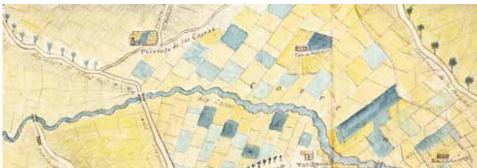
FIG.09. MARTÍNEZ SANTISO, F. J. (1877). Detalle do barrio das Cascas no Plano de la ciudad de Betanzos . Arquivo Municipal de Betanzos.

que máis alá deste río aparecen representados varios elementos, o máis rechamante é o Carregal, toda esa zona comprendida entre a Fábrica Etcheverría e a Fábrica Molezúm , dúas fábricas de curtidos que quedaban ao pé dun antigo camiño que conectaría o barrio da Magdalena e o das Cascas ata a chegada, en 1955 (Arcay & Teijeiro) da estrada de circunvalación que modificaría para sempre a paisaxe do Parque do Pasatempo. Como o mapa é anterior ao inicio das obras dos García Naveira non aparece representado o parque enciclopédico neste documento, sendo as seguintes referencias as que aparecen en torno ao barrio das Cascas, por unha banda o Priorato de las Cascas e pola outra os dous camiños que aparecen aos seus lados, o Camino de la Enfesta e o Camino que va a Sta. Cruz de Mondoy , correspondéndose esta última vía ca actual Avenida Jesús García Naveira e co camiño que logo conduce ao lugar de Roibeira, xa que por outra parte existe a Cuesta de las Cascas , a vía que dende o alto do Rollo descende ata o leito do Mendo e ata a antiga ponte.