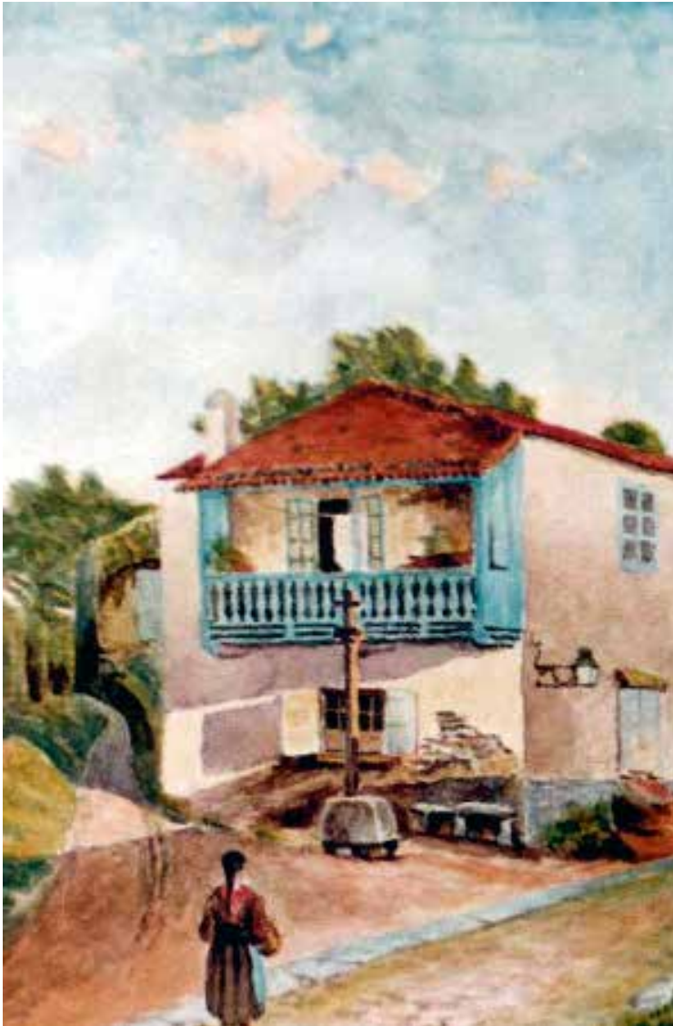
FIG.13 MARTÍNEZ SANTISO, F. J. (c.1930) O antigo cruceiro do Rollo . Colección particular de José Raimundo Núñez-Varela y Lendoiro.

En canto á vila amurallada, a representación sinxela que realiza do conxunto monumental permite apreciar a morfoloxía das rúas máis importantes (rúa Nova, Prateiros, Cerca, Ferreiros e rúa Travesa) destacando simplemente tres elementos en todo o debuxo, as igrexas de San Francisco, Santa María e Santiago. Aparecen tamén, aínda que sen nomear, as portas da muralla, incluídos os chanzos da Porta do Hórreo ou o xardín de diante da igrexa dos franciscanos.