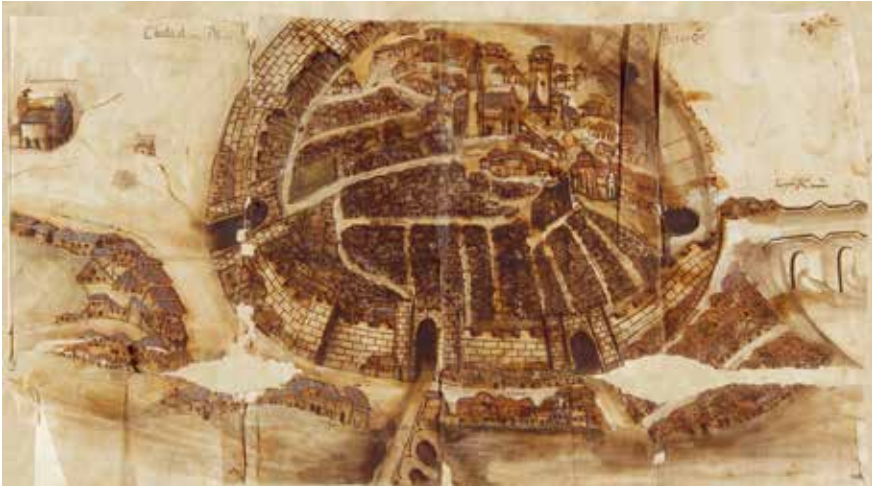
FIG.01. VÁZQUEZ, A. (c.1616) Mapa do incendio de 1616 . Archivo Histórico Nacional.

Seguindo o fio cronolóxico, e non sempre cumprindo exactamente cunha imaxe a escala, a seguinte representación que atopamos sería de dous séculos despois, en concreto de 1823, conservado no Archivo Cartográfico y de Estudios Geográficos de Madrid. Existen outros anteriores pero que se centrarían especialmente na parte marítima, sen facer unha representación directa do núcleo urbano. No de 1823 non podemos apreciar as referencias ao noso patrimonio cultural pero si que están marcados os camiños que saen do núcleo urbano (o camiño real de Lugo, o da Coruña, o de Pontedeume ou o de Vilalba), os xuncais que rodeaban á cidade amurallada e varias referencias de barrios e localizacións como son os de a Angustia, Illobre, a Magdalena (cas fábricas de curtidos dos Etcheverría e do Carregal), a Ponte Nova, as Cascas ou Santa María del Camino, denominación ca que aparece o templo dos Remedios. Existe tamén unha referencia á Fuente del Angel que parece facer referencia, no río Cascas, á fonte da barriada dos Ánxeles. Este plano está copiado y reducido a la escala de 1/10000 del plano perteneciente al Ayuntamiento , aparecendo a escala recollida no tamaño denominado pies de Burgos , unha das denominacións que se lle daba ao pie castellano e que era unha medida de lonxitude tradicional que correspondería a 0,278635 metros, algo máis curto que o chamado pé romano, que abarcaría 0,2957 metros.