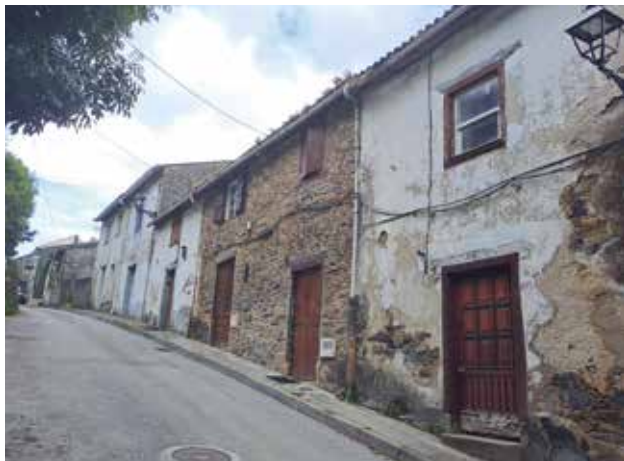
Imaxe 21. Vivendas na Condomiña con planta e tipoloxía das antigas casetas da orde dos Lazarados, que foron habitadas por oleiros e outras familias humildes.