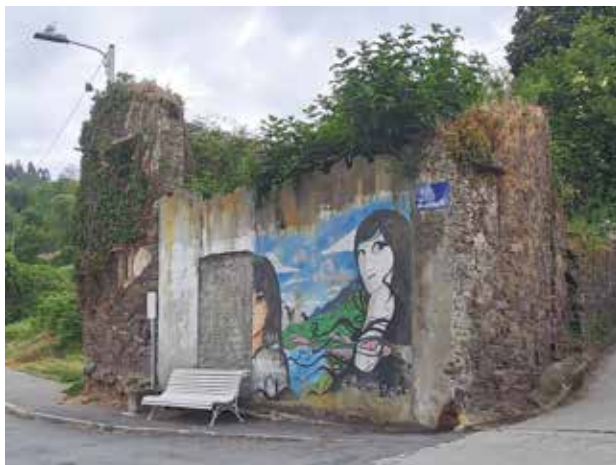
Imaxe 24. Foto do autor, XTR, 2023. Edificio do antigo lagar da Orde dos Lazarados.

Porén é de lamentar que este intento de recuperación da olaría da Magdalena non tivese continuidade e non se acadase o obxectivo do «ensino desta artesanía a xente nova co fin de continuar a tradición», como apuntaba o colectivo Untia na súa publicación. Como tamén é de lamentar que este barrio con raiceiras medievais (ou, cando menos, do século XVI) carecese dunha protección que evitase unha urbanización pouco respetuosa co medio, consentise a destrución dos restos históricos da arquitectura industrial e permitise a degradación e ruína do rueiro antigo, especialmente visible nas vivendas da costa da Condomiña, herdeiras das antigas casetas dos lazarados. Como apuntou García Otero (2005) nesta mesma publicación, e compartimos: «El barrio de la Magdalena de Betanzos es un ejemplo claro de lo que nunca hay que hacer con la memoria de los pueblos y con la arquitectura popular». 12