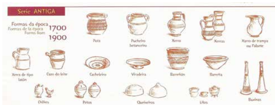
Imaxe 8. O «pucheiro betanceiro» no catálogo Olaría de Buño (1998, aprox.), entre as formas dos anos 1700 e 1900.