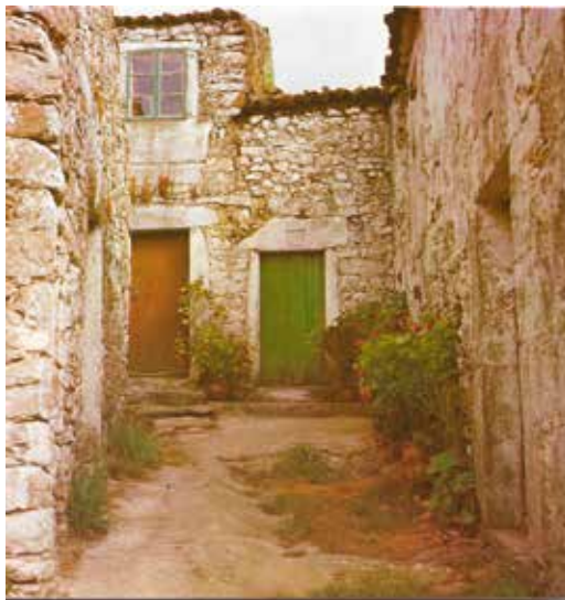
Imaxe 7. Recuncho de Buño.