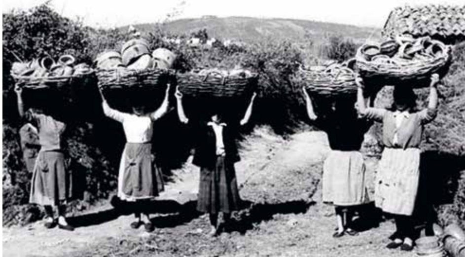
Imaxe 5. Fotografía extraída de https://gl.wikipedia.org/wiki/Bu%C3%B1o,_Malpica_de_Berganti%C3%B1os?uselang=es (Consulta 13-05-2022) con este pé: «Mulleres carretando o traballo dos oleiros (c. 1915)».