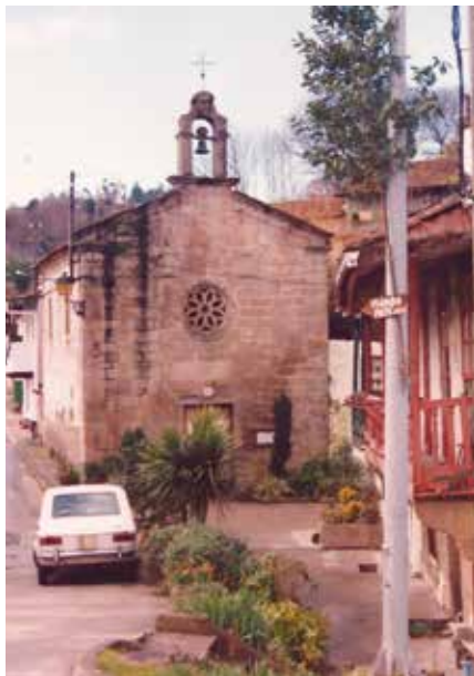
Imaxe 14. Foto do autor, XTR, 1990. Capela da Magdalena.

A materia prima, o barro, obtíñano os oleiros da Magdalena nuns terreos pantanosos próximos ao río Mero, na freguesía de Piadela, de propiedade particular pagando por unha determinada extensión de terreo. Nel facían as extraccións só durante os meses de verán para todo o ano, que logo almacenaban, pois os pozos excavados a ceo aberto tendían a encharcarse. Alí existían, nas inmediacións do río Mero, dúas telleiras ou fábricas de tella e ladrillo, que chegaron a ser catro, e pasaron por diferentes propietarios 8 . Tamén empregaban os oleiros da Magdalena un barro branco que obtíñan nas inmediacións da praia de Mera, no concello de Oleiros, para as superficies das vasixas que levaban vidrado de chumbo.