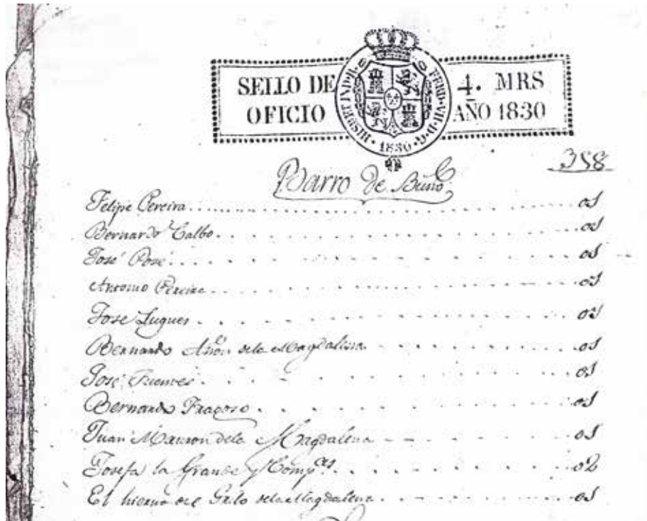
Imaxe 9. AMB, c. 1741. Listado de persoas que cotizan por «Barro de Buño» nun documento de 1830.

En 1839 temos noticia da existencia dunha fábrica ou obradoiro de alfarería no barrio da Magdalena. Nese ano dátase o último caso de lepra en Betanzos. Unha muller é obrigada a recluírse na Magdalena. Autorízasele «a mendigar en la puerta de la casa que se le destina, en la capilla de la Magdalena, o junto a la muralla que cierra la fábrica de Barro de la pertenencia de los herederos del Sr. Roldán.» (Fernández, 1997: 63). Isto implica a presenza de traballadores oleiros e quizá a chegada para traballar nela dos primeiros oleiros procedentes de Buño asentados na Magdalena.