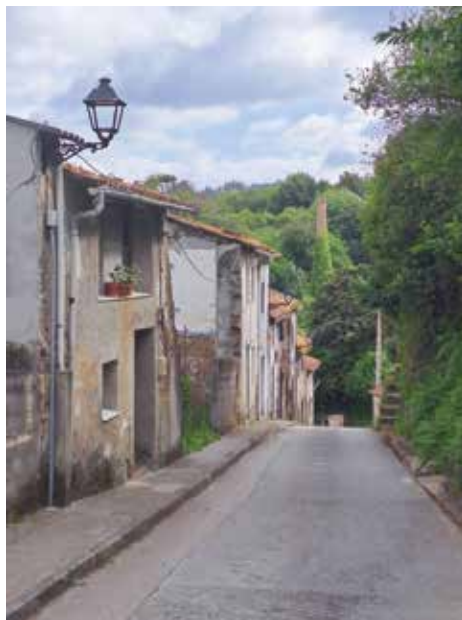
Imaxe 12. Foto do autor, XTR, 2013. Unha parte da Condomiña coa cheminea da antiga fábrica de curtidos ao fondo. As vivendas adosadas manteñen a tipoloxía das casetas dos lazarados.

A construción do camiño de ferro Betanzos-Ferrol, inaugurado en 1912, transforma tanxencialmente o barrio, ao desviarse o antigo cauce da ría e producirse grandes recheos de terra para asentar a vía férrea e a propia estación do ferrocarril, que