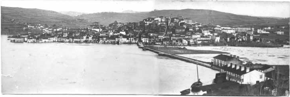
Imaxe 2. F. J. Martínez Santiso, 1900, AMB. Vista xeral de Betanzos en pleamar tomada dende a Magdalena, coas primeiras casas do arrabalde e o pequeno embarcadiro na parte inferior dereita.