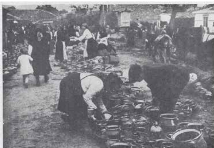
Imaxe 6. ACG, revista mensual ilustrada del Aero-Club de Galicia, n.º 106, 1-03-1939. Fotografía que aparece na reportaxe «Las ferias gallegas siguen abastecidas», co pé «Un puesto del célebre “barro de Buño”».

Lucas Labrada na súa Descripción económica de Galicia , publicada en Ferrol en 1804 e que recopila datos de finais do século XVIII, reférese nunha relación do ano 1797 unicamente a un total de 14 fabricantes de louza, repartidos en 6 mestres e 8 oficiais, sen ningún aprendiz, cantidade ben reducida para todo o país galego. Con respecto a Buño, facía constar que a louza das parroquias de Buño e Leiloio concorria aos mercados semanais da Coruña e, seguramente tamén, á feira anual de decembro que duraba unha ducia de días. Probablemente, tamén se comercializaba nas feiras da comarca de Bergantiños máis próximas a Buño, que cita, como eran as de Paiosaco, Rus e Verdillo, que se celebraban o primeiro, segundo e cuarto domingo do mes, respectivamente, aínda que nestes casos Labrada non nomea a louza.