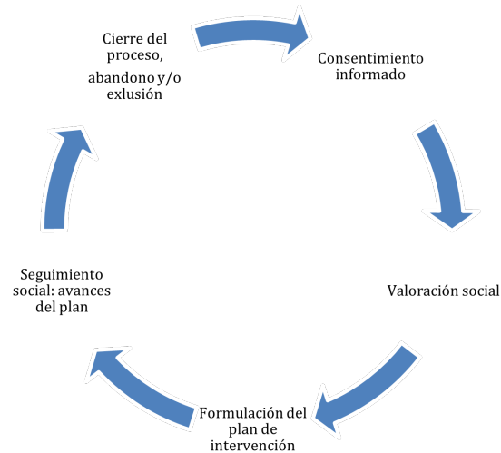
Figura 3. Proceso de atención social brindado a las sobrevivientes