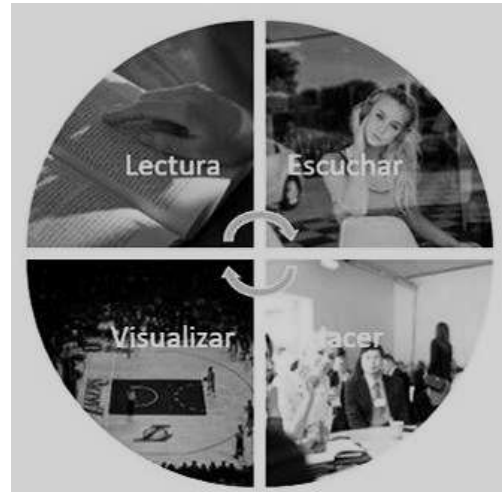
Figura 4. Cualidades de los videogramas como recurso educativo. Imagen elaborada por la autora utilizando imágenes tomadas de internet.

El uso de videogramas reúne cualidades que los hacen apropiados y atractivos para los estudiantes, con características acordes a los diferentes estilos de aprendizaje. Ver Figura 4 .