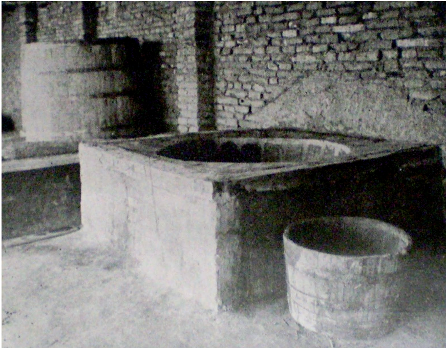
Figura 6. “Horno del ingenio restaurado” (pie de figura original).

Con relación a la chimenea, jamás es mencionada en la literatura histórica, pero sí expuesta en las fotografías desde 1916. Dado el estado general del conjunto arquitectónico registrado en las Figuras 2 y 3 (1909-1913), es difícil asumir que se trata de una chimenea centenaria; en cambio, sostenemos que también fue parte de las obras de 1916. Las excavaciones arqueológicas al pie del asiento del “fondo” posibilitaron registrar la conexión entre éste y la chimenea original, por lo que sugerimos –por la dirección hacia donde se proyectaba el canal subterráneo– que la chimenea de 1916 fue reconstruida sobre la base de aquella.