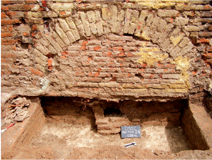
Figura 8. La hornalla en proceso de excavación (II). Observar: la boca de la hornalla despejada. El piso de la hornalla se detectó a 1,36 m de profundidad. Es decir, esa es la profundidad a la que se hallaba el operador de la hornalla.

Figura 7. La hornalla en proceso de excavación (I). Observar: el arco de medio punto detectado después de la demolición de los recintos en la sección este del galpón; por debajo del nivel del piso: la boca de la hornalla tapada intencionalmente con mampuestos.