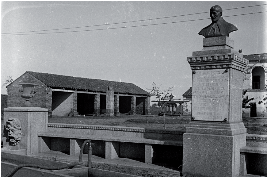
Figura 10. La Casa del Obispo post-1916.

Desde el registro documental post-1916, sin embargo, se desprende que apresuradamente el conjunto comienza a deteriorarse, incluso el trapiche ya