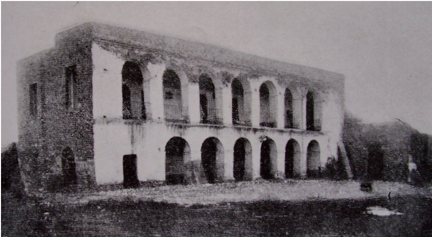
Figura 3. “Casa del Obispo Colombres”. Observar la ausencia del recinto al oeste del edificio.

Figura 2. “Casa del Obispo Colombres”. Observar a la derecha de la Casa (oeste del edificio) el recinto anexado y una persona apoyada en la esquina. Fuente: Schleh (1910).