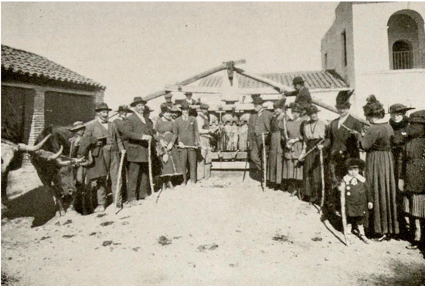
Figura 9. Visitantes apropiándose del trapiche. Observar: las “cañas” que portan en sus manos y el “jugo” en las mazas del trapiche.

Pero hay más, ya que la escenificación del patrimonio adquirió una dimensión pedagógica singular, en el marco de una recreación sin precedentes: el trapiche de madera –colocado entre el edificio de dos plantas y el galpón– es puesto en funcionamiento como en el pasado, a tracción a sangre (con bueyes). Tal como se observa en la Figura 9, los/las visitantes tienen cañas en sus manos y, al colocarlas en el trapiche, participaban de la molienda (de hecho, puede observarse el “jugo” impregnado los cilindros, mazas o rodillos del trapiche). En otras palabras: un ejemplo muy práctico de cómo, en la actualidad, deberíamos concebir los recursos culturales, es decir, siendo activados y manipulados por quienes se acercan a ellos. En efecto, de acuerdo al registro fotográfico y lo relevado en el mismo monumento histórico , ninguna de las intervenciones museográficas posteriores a la de 1916 generaron un nivel didáctico y pedagógico como el logrado hace ya más de un siglo.