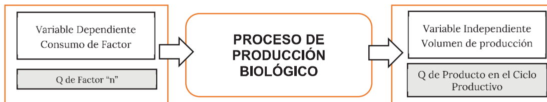
Imagen 3. Diagrama del proceso de producción biológico según la TGC