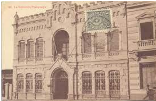
Imagen 1. Local de la Industrial Paraguaya

coerción física la fuerza de trabajo de más de 9.000 obreros rurales. La más emblemática fue La Industrial Paraguaya, asociada al capital anglo-argentino, fundada en 1886, que llegó a adquirir a precios irrisorios más de 2,6 millones de has. de tierras, incluyendo no menos de 855.000 has. de yerba mate natural explotando la fuerza de trabajo de unos 5.000 obreros rurales (Herken, 1984; Pastore, 1972). No sorprende el hecho de que el presidente de la República, que sancionó la Ley de la Venta de los Yerbales del Estado, aparezca entre los fundadores de la Industrial Paraguaya.