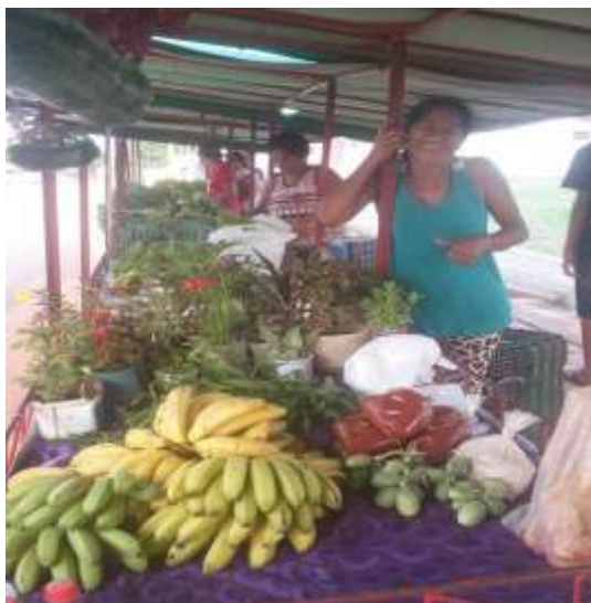
Figura 03 - Mulheres do MMC na feira das camponesas em Bujari – Acre.