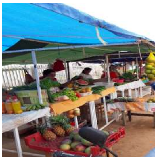
Figura 04 Mulheres do MMC na feira. Bujari – Acre.

A fotografia demonstra as mulheres do MMC Bujari, na busca de autonomia financeira, através da comercialização de seus produtos cultivados e confeccionados em suas propriedades. É importante registrar as falas dessas mulheres, pois, através desses espaços de fala, conseguimos divulgar as suas ações na busca de superação das desigualdades entre os sexos ainda existentes.