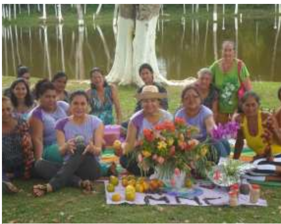
Figura 01 - Formação política para mulheres do MMC – Acre. Bujari – Acre

Conseguimos notar, no decorrer da fala da líder, que o MMC encontra-se muito bem articulado a nível nacional e local, uma vez que conseguiu uma forma de organização que permite um diálogo escalar. Ou seja, trata-se de uma espécie de rede de mulheres devidamente estruturada em que as demandas são discutidas do local para o global. Em seguida, após sistematização e estudo do cenário, as lideranças maiores buscam promover ações para reverter contextos que descaracterizam o movimento ou situações vividas por suas companheiras.