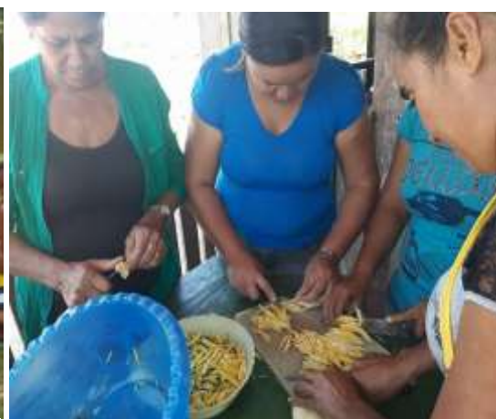
Figura 02 - Curso de reaproveitamento de alimentos, ofertado para as mulheres do MMC – Bujari. Figura cedida por BRANCO, G. C. Bujari – Acre, 2018.

As figuras mostram algumas dessas ações desenvolvidas com as mulheres do MMC Bujari. Trata-se da formação política de mulheres através de oficinas, seminários, cursos e palestras, com temáticas como a Lei Maria da Penha e o direito das mulheres. Essa rede tem buscado libertar umas às outras das garras da violência. Apesar da falta de CNPJ para o movimento, os atores envolvidos estão buscando levar qualificação profissional para essas mulheres e importantíssimos esclarecimentos. Em parceria com as associações dos assentamentos, as lideranças locais têm buscado desenvolver um trabalho libertador. Uma das poucas desvantagens constatadas encontra-se no fato, de muitas vezes, as ações do movimento ficarem invisibilizadas frente às ações das associações de moradores.