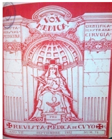
Imagen 2: Portada de la Revista Médica de Cuyo