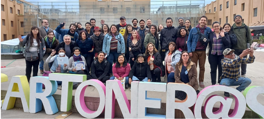
Foto del Encuentro Internacional de Cartoneras de 2022.