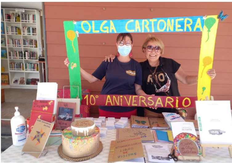
Celebración de los 10 años de Olga Cartonera en 2022.

haya, más se crearán. Las redes sociales masificaron algo que hace 20 años, cuando apareció Eloísa, no había forma de mostrarlo. La necesidad siempre ha estado, ahora se visualiza el cómo hacerlo.