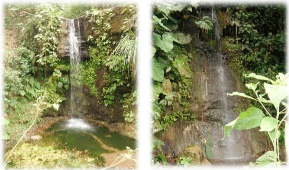
Figura 3. Cascada Primera Piedra