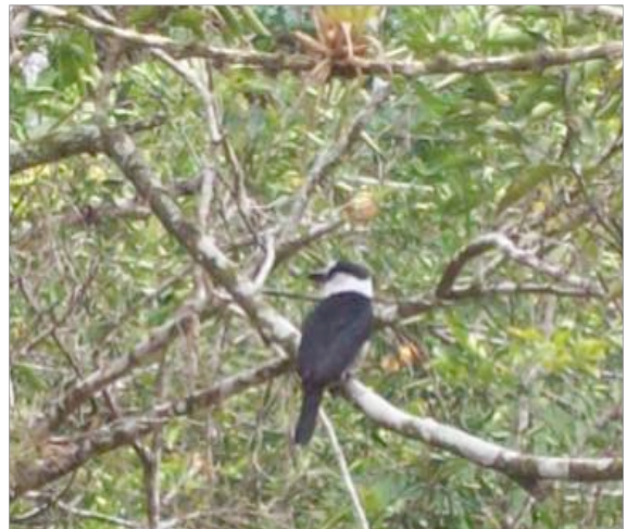
Figura 11. Flora y fauna del sitio Conguillo