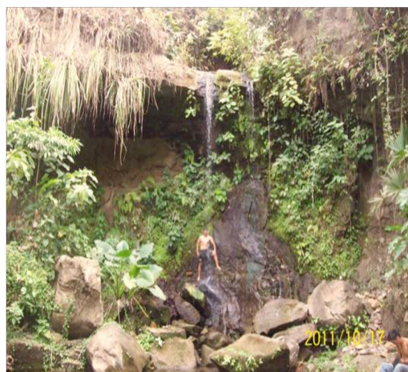
Figura 10. Cascada los Mulatos

Se pueden realizar caminatas, senderismos, observación de fauna y flora, entre otras.