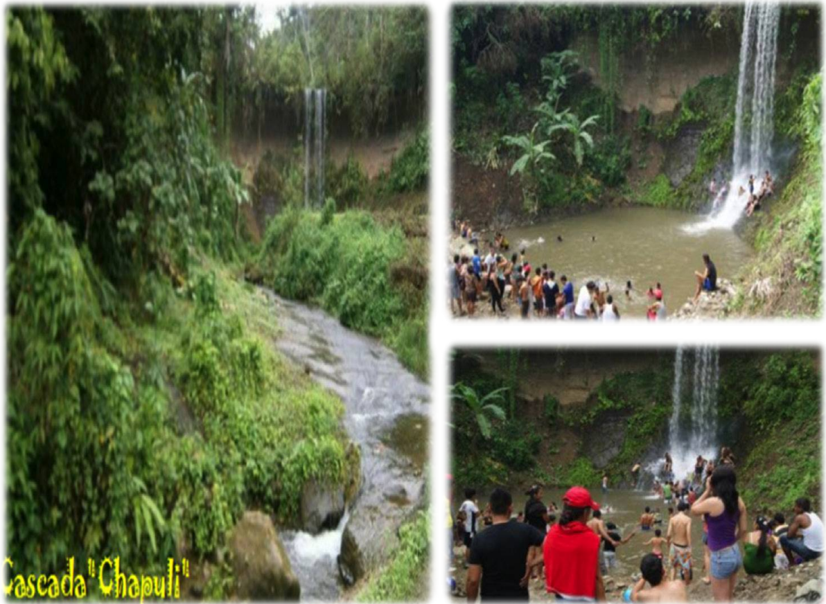
Figura 2. Cascada de Chapulí