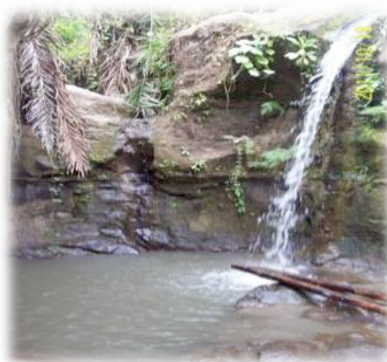
Figura 5. Cascada La Mina

Se pueden realizar caminatas, senderismos, camping, observación de fauna y flora, entre otras.