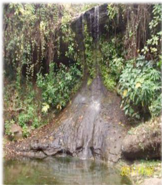
Figura 4. Cascada Tigre - Dos Bocas

Se pueden realizar caminatas, senderismos, camping, observación de fauna y flora, recreación entre otras.