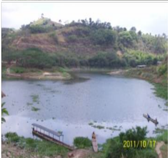
Figura 9. Puerto El Dique