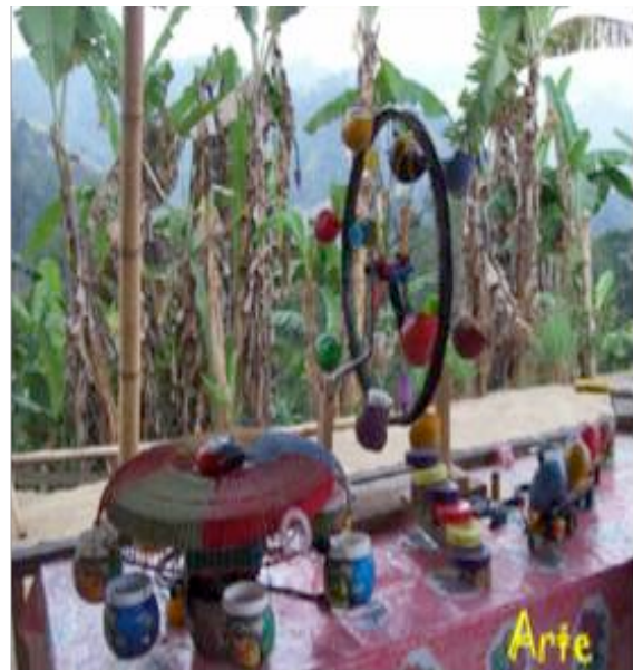
Figura 7. Manifestaciones culturales, diseños a escala