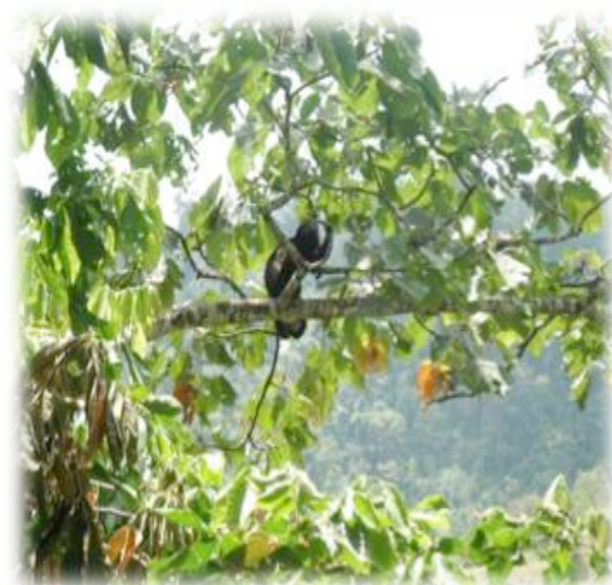
Figura 6. Bosque protector La Mina