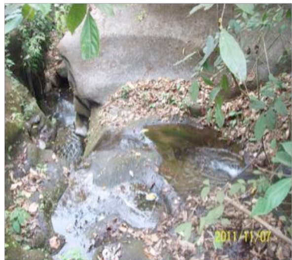
Figura 12. Salto de agua Mata de Plátano

Se pueden realizar caminatas, senderismos, observación de fauna y flora, entre otras.