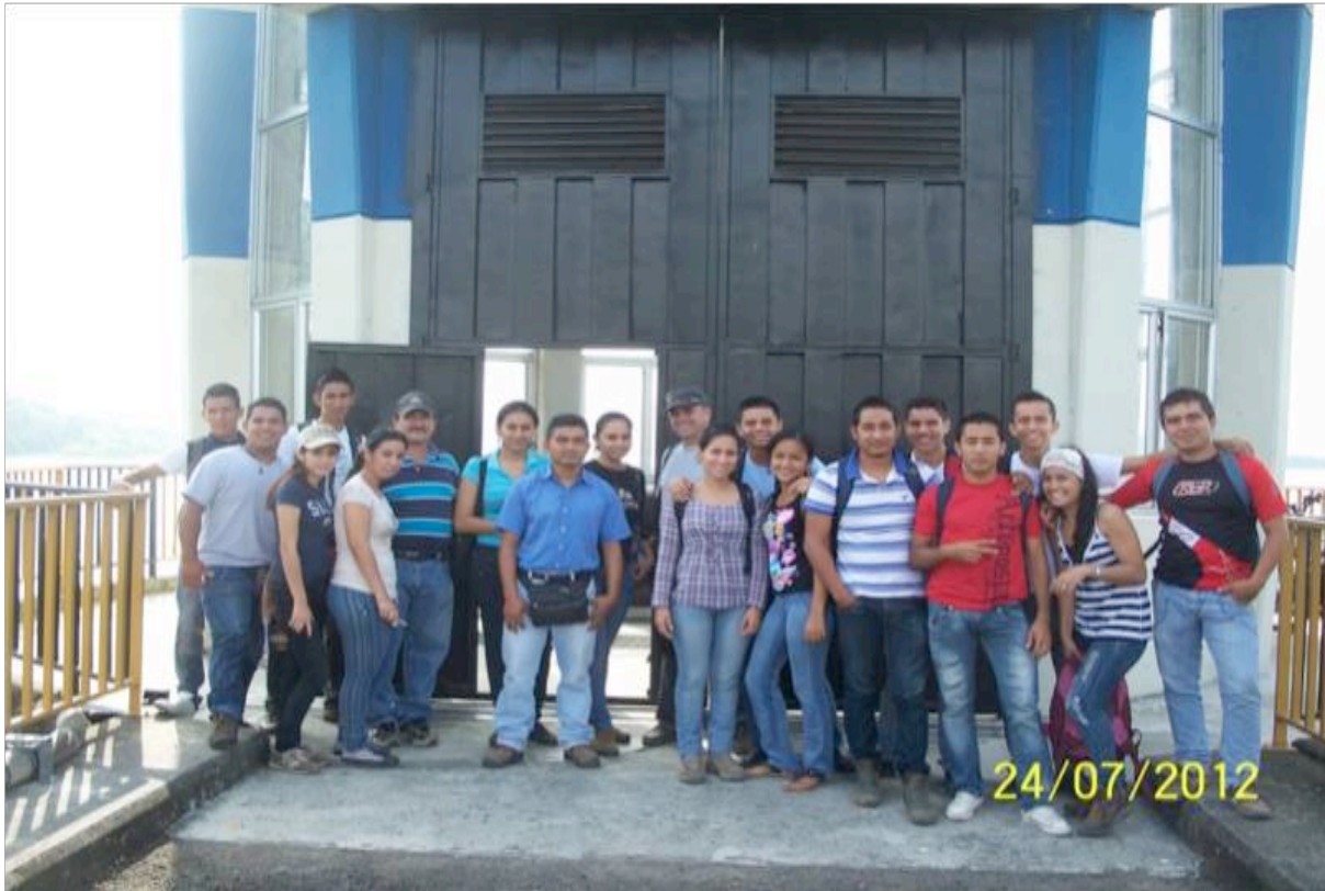
Figura 6. Visita especializada de los estudiantes de agrícolas a la infraestructura hidráulica del territorio atendidas por funcionarios y técnicos del proyecto de la microcuenca Membrillo

Los sistemas de riego deben ser explotados de forma eficiente para que toda el agua que se le aplique a los cultivos sea utilizada por este en su mayor porcentaje, por lo que se debe evitar al máximo posible las pérdidas por evaporación, percolación profunda y escurrimientos. Este uso eficiente y sostenible del agua puede lograrse con el empleo de prácticas sostenibles en la que los productores y profesionales juegan un rol insoslayable.