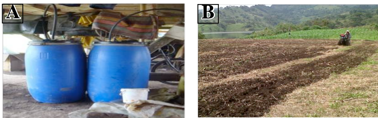
Figura 3. Producción de Bioles mediante los microorganismos (A)eficientes y empleo de motocultor para la preparación de los suelos (B)

En la Figura 3 (A y B) se observa la producción de Bioles mediante los microorganismos eficientes, de gran aceptación para el control de plagas y enfermedades, así como el empleo de motocultor para la preparación de los suelos, lo que mejora la preparación del mismo, se gana en eficiencia, se logra una mayor productividad, y se humaniza el trabajo.