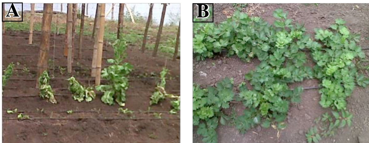
Figura 2. (A y B) Construcción de huertos familiares para la producción de hortalizas, con la instalación de sistemas de riego artesanales

En la imagen C la conformación de las camas, así como las tuberías que alimentan a las camas, y las hortalizas en fase de desarrollo, y por último en la imagen D se exhibe estudiante pasante observando el desarrollo de las hortalizas en condiciones de huerto.