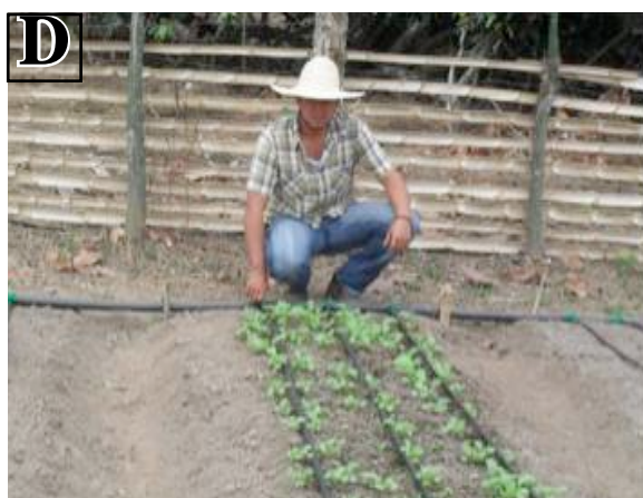
Figura 1. (A, B, C y D) Montaje de sistema de riego artesanal para la producción de hortalizas en huertos familiares