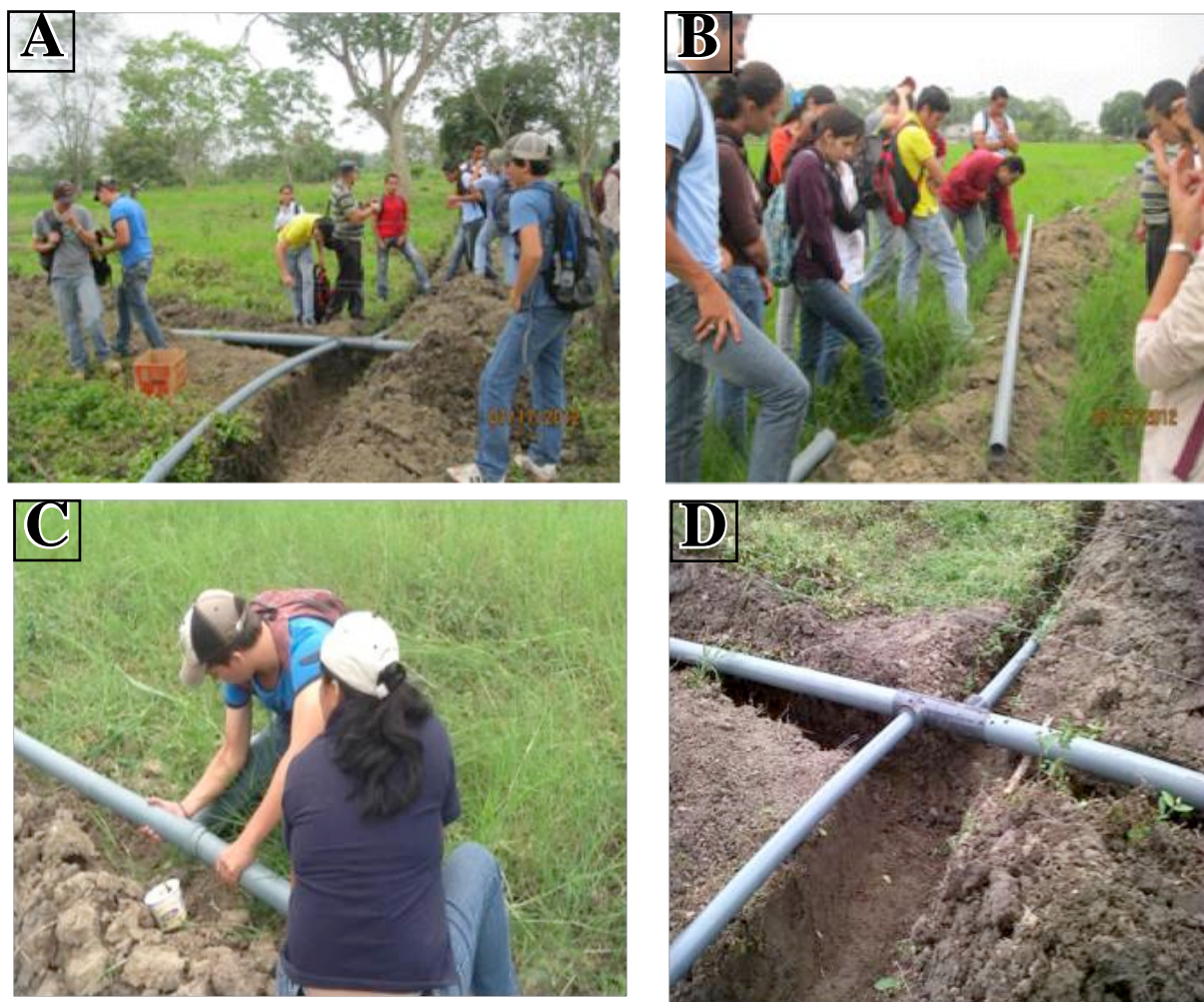
Figura 8. (A,B,C,D) Momentos en que los estudiantes de Ingeniería Agrícola participan en el montaje de un sistema de riego presurizado