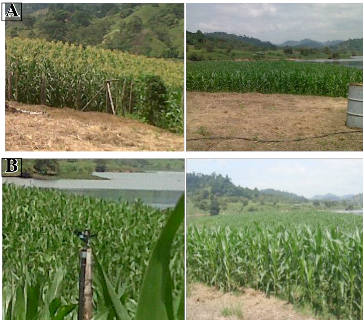
Figura 4.(A,B) Producción de maíz todo el año con tecnología sustentable con labores de cultivo

En la Figura 4 (A y B), se observa el estado de desarrollo que posee el maíz que se obtiene todo el año con tecnología sustentable en las labores de cultivos de preparación del suelo, siembra, sanidad vegetal y manejo del riego, lo que se convierte en un resultado de extraordinario valor para para los productores al ver como pueden obtener parte del sustento de la familia todo el año, y no producir solo en le periodo de invierno donde las cosechas pueden estar sujetas a grandes precipitaciones con afectaciones significativas en los rendimientos.