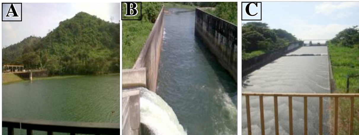
Figura 7. (A,B,C) Infraestructura hidráulica que contribuye al desarrollo agroproductivo del valle Carrizal-Chone

Además, debe lograrse la instalación de sistemas de riego con la calidad requerida que garanticen el ahorro de recursos y el suministro de agua de forma eficiente a los cultivos, es por ello que es importante que los profesionales que se forman en la rama agrícola adquieran de forma sólida los conocimientos y habilidades en estas ramas de las ciencias.