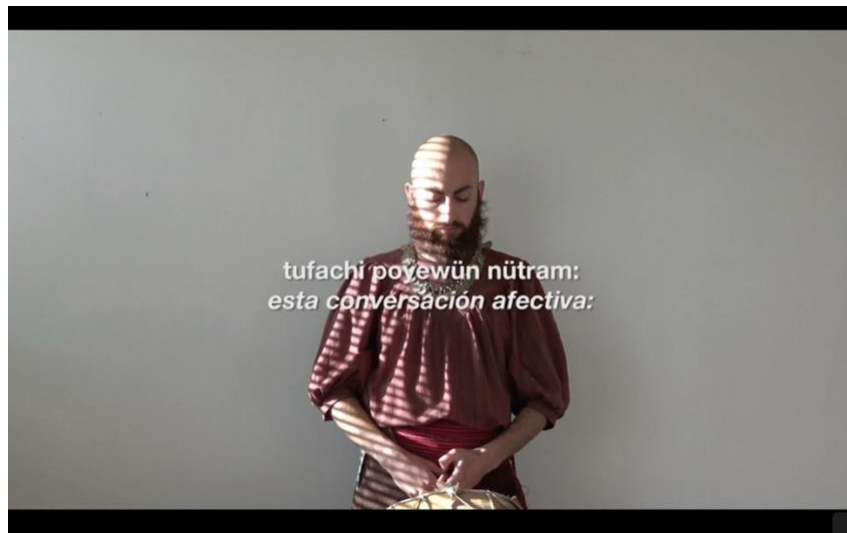
Fig. 6 y 7.

Kizungünewün epupillan/Autodeterminación dos espíritus (2019). Comunidad Catrileo+Carrión