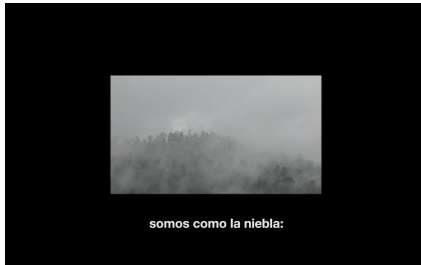
Fig. 4. Kizungünewün epupillan/Autodeterminación dos espíritus (2019). Comunidad Catrileo+Carrión

En el caso del hablante en el capítulo 3, “Amor”, su escritura se expresa en contacto con la tierra arcillosa, la lluvia y la humedad, generando así una superficie de archivo. En efecto, la tierra no es un simple objeto de escritura-visual, es principalmente residuo de memoria estética (Depetris y Urzúa), puesto que, en el campo de los rastros fósiles, se interpreta que las capas intermedias del suelo constituyen huella mnémica de especies humanas y no-humanas.