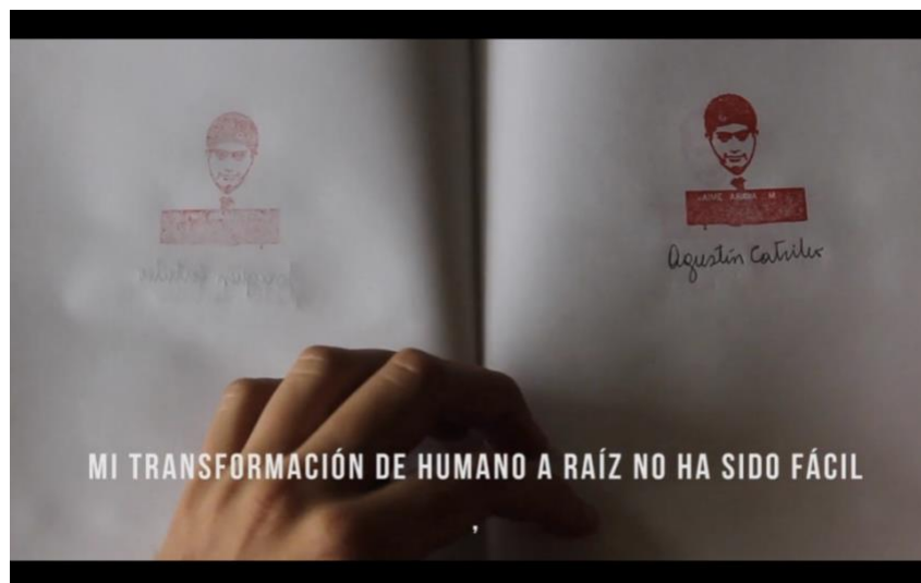
Fig. 5. Famew mvlepan kaxvlew [or an archeology of renaming] (2017). Comunidad Catrileo+Carrión

Se trata pues de una destrucción de la lengua y, de igual forma, de una destrucción del origen legible que intentara archivar el mito del Calibán como germen patriarcal nominativo, pues a pesar de su ignominioso aspecto, se identificó al vasallo con la capacidad vigorosa del macho para ejercer trabajos útiles y prácticos (Vignolo). Se ha de recordar que luego de renegar de la lengua de su amo, el Calibán deviene hombre sumiso-rebelde, pero también, y junto con ello, condición masculina de una antropodicea emancipatoria, en desmedro de una naturaleza femenina encarnada en la bruja Sycorax. Y a pesar de ello, a pesar del binarismo masculino-femenino, este nefando perverso es la consecuencia de un sin nombre, una X según la versión de Césaire (134); el hombre sin nombre en el devenir, acaso, de un cromosoma X incuantificable.