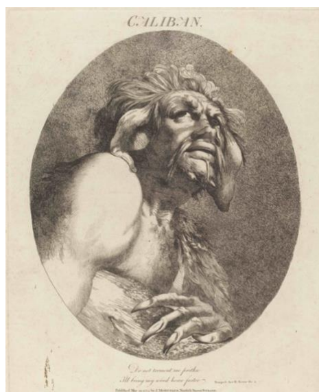
Fig. 1. Caliban (1775). John Hamilton Mortimer. National Gallery of Art

“Usted me enseñó a hablar y el provecho que obtuve es que ahora se maldecir” (v. 365. Shakespeare 61) resuella el monstruoso Calibán a los pies de su amo. “¡Que la peste roja le caiga encima por haberme enseñado su idioma!” (v. 365) vocifera desde la inquina transformada en rebeldía. Aquí, bajo la calamidad de hablar una lengua opresora subyace no solo la dialéctica del amo y el esclavo que anticipara el romance sobrenatural escrito por Shakespeare en 1611, La Tempestad , también la condición tempestuosa de un momento transformador del conocimiento en el que el vasallo se libera en búsqueda de otros dioses.