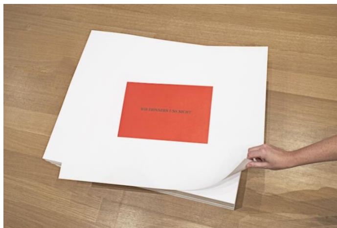
Fig.4: Sin título (We don't remember) (1991) Feliz González Torres.

“Un árbol solo puede ser tan fuerte como el bosque que lo rodea” (Wohlleben 17): esta cita nos ayudó a comprender la importancia de la comunidad. Por sí solo, un árbol alejado del apoyo que una comunidad forestal brinda a través de las redes de micorrizas no puede construir un ecosistema o vivir una vida larga, pues está más expuesto a amenazas, como el clima dañino. Con el apoyo enriquecedor de una comunidad conectada, su vida se extiende. Apartados de la red de madera, los árboles carecen de la información que necesitan para comprender su entorno y desarrollar resiliencia. La interdependencia es clave para el crecimiento de un bosque y solo es posible gracias al hongo que conecta a los individuos unos con otros para compartir conocimientos y recursos. Las redes de micorrizas nos recuerdan el poder del conocimiento colectivo y la descentralización del poder. Cuando múltiples perspectivas y sistemas de conocimiento reciben apoyo, reconocimiento y autonomía, el resultado es el crecimiento colectivo.