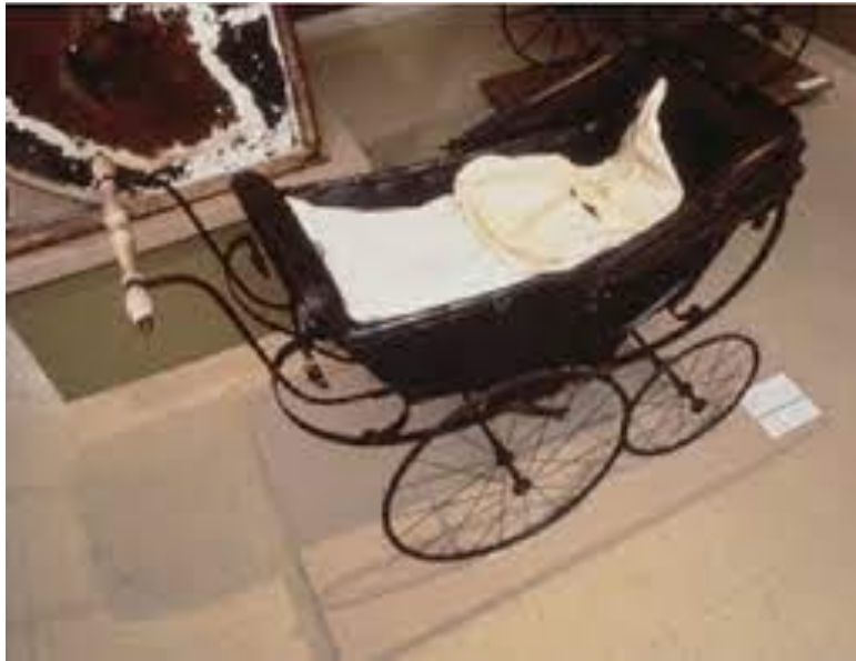
Fig.2: Mining the museum (1992) Fred Wilson.

Claire Bishop, en su libro Museología radical , postula que los museos tienen hoy la oportunidad de ser contrahegemónicos y que “el museo, como un agente histórico activo, habla en nombre no del orgullo nacional ni de la hegemonía, sino desde el cuestionamiento y el disenso creativo” (Bishop 83). La obra de Fred Wilson abre esta posibilidad en un museo histórico y establece un orden desbalanceado no para una nueva historia, sino para crear incomodidad sobre la historia ya escrita. Con este cambio de jerarquía despierta en la audiencia nuevos conocimientos y cuestionamientos. Esta obra permite ver que la museología, como se concibe hasta ahora, ha quedado obsoleta y no ha entrado en una discusión decolonial.