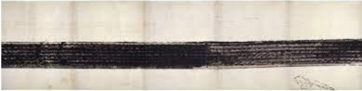
Fig. 1: Automobile Tire Print (1953) Robert Rauschenberg.

Las percepciones y conocimientos que obtenemos de la naturaleza pueden convertirse en metáforas que nos ayuden a comprender mejor nuestras experiencias. A medida que aplicamos estas metáforas nacidas de la observación de los procesos y sistemas naturales a los métodos de enseñanza, aprendizaje y organización comunitaria, nos involucramos en la biomimética, una práctica antigua (Brown 16-17). En los tiempos modernos, esta práctica se usa a menudo en el campo de la ingeniería. Sin embargo, estamos interesadas en comprender cómo los procesos y sistemas dentro de la naturaleza pueden ofrecer también estrategias para el aprendizaje y la organización comunitaria. Queremos descubrir los planos de la naturaleza para construir futuros positivos que respalden el crecimiento colectivo y provoquen una mirada menos alienada de las audiencias hacia la naturaleza, cuestión importante para proponer una pedagogía decolonial (Berryman, Soohoo y Nevin 20).