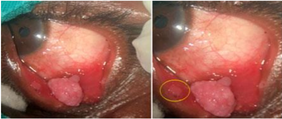
Figura 1. Fotografía de lesión de papiloma conjuntival en ojo

Fuente. Rojas Rondón I, Múzquiz Jiménez MA, Audivert Hung Y, Miqueli Rodríguez M, Álvarez Garay MI, Vigoa Aranguren L. Papiloma conjuntival. Revista cubana de oftalmología. 2020.