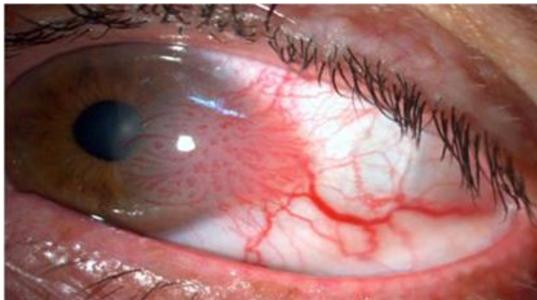
Figura 2. Ejemplo de ojo afectado por papiloma corneal

Fuente. Frómeta-Ávila M, Velázquez-Matos M, Cobas-Díaz L. Carcinoma epidermoide de la conjuntiva ocular. Presentación de un caso. Revista Información Científica. 2020.