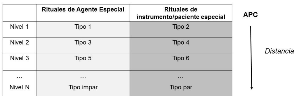
Figura 3. Tipos de rituales religiosos (la ilustración es una adaptación simplificada nuestra, del modelo de McCauley & Lawson, 2002).

Esta tipología permite plantear ciertas conjeturas, como ser que, dentro de una comunidad religiosa en particular, el grado de intensidad sensorial será mayor cuando se trata de tipos impares en relación a los pares, sin importar la profundidad ritual. En los tipos impares, la conexión con el “agente” del ritual involucra una acción más directa del APC, que requiere una “pomposidad” mayor para demostrar la importancia de la acción realizada. Las extremas emociones provocadas en este tipo de rituales son útiles para persuadir a los participantes de que los cambios extraordinarios se han producido efectivamente. A su vez, rituales impares -como casamientos, ordenaciones o ritos de iniciación- no son repetidos generalmente, dado que la autoridad religiosa intermediaria del APC garantiza efectos “superpermanentes”. Por el contrario, los tipos pares de rituales requieren ser realizados más frecuentemente dado que no tienen efectos “superpermanentes”, y requieren menos “pomposidad” ya que están más alejados de la presencia “sobrenatural” del APC. Vemos entonces como estos dos principios permiten clasificar los rituales en sus distintas características: la reversibilidad o irreversibilidad de su efecto, la necesidad de repetición, el lugar central o periférico del mismo en el sistema religioso, el grado de componentes emocionales o sensoriales.