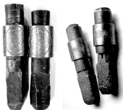
Fig. 4-a. Rodillos, o “muñecas” para la acuñación a molino. Entre ambos rodillos circulaba un riel sobre el que se imprimían multitud de monedas que después se recortaban del riel mediante un sacabocados o volantillo 70 .

Fig. 3. Monedas de las series de Vellón de Busto. De izquierda a derecha y de arriba abajo: dos maravedís acuñados entre septiembre y octubre de 1660 en puro cobre a martillo (Primera Serie del Vellón de Busto), en la Casa de la Moneda de Madrid (“MD”); ocho maravedís de vellón auténtico a martillo de 1661 (Segunda Serie del Vellón de Busto) y de la ceca Trujillo (“TRo”), y dieciséis maravedís de vellón auténtico a molino de 1661, ceca Trujillo (“TRo”) (Tercera Serie del Vellón de Busto).