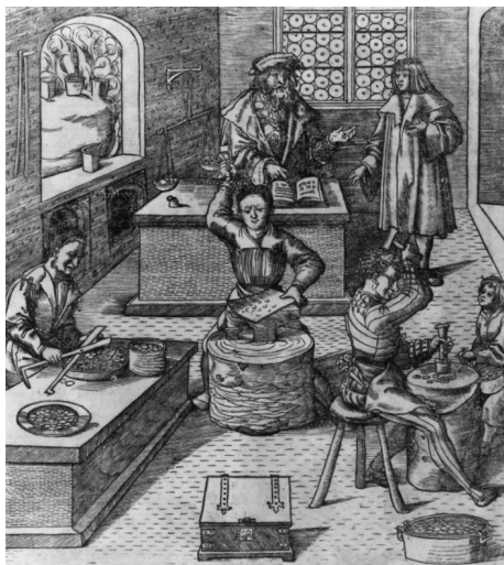
Fig. 2. Grabado alemán del siglo XV en el que se observan los distintos oficios ligados a la acuñación a martillo, observándose en la posición inferior derecha a un acuñador con sus herramientas de troquelado ( Visita en 1517 del emperador Maximiliano I a la sala de la moneda de Tyrol . Xilografía de Hans Burgkmair el Viejo, 1473-1531).