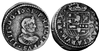
Fig. 3. Monedas de las series de Vellón de Busto. De izquierda a derecha y de arriba abajo: dos maravedís acuñados entre septiembre y octubre de 1660 en puro cobre a martillo (Primera Serie del Vellón de Busto), en la Casa de la Moneda de Madrid (“MD”); ocho maravedís de vellón auténtico a martillo de 1661 (Segunda Serie del Vellón de Busto) y de la ceca Trujillo (“TRo”), y dieciséis maravedís de vellón auténtico a molino de 1661, ceca Trujillo (“TRo”) (Tercera Serie del Vellón de Busto).