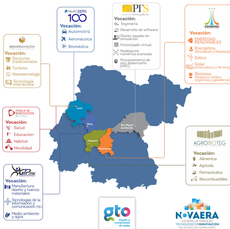
Ilustración 2 Instituciones que forman parte de NOVAERA

Nuestra labor es acelerar, catalizar las ideas, los proyectos que en nuestro estado se van desarrollando. El talento se tiene, las ideas también, solo es cuestión de desarrollarlas para ponerlas en marcha. Las interacciones y las transacciones de conocimientos facilitadas derivan en nuevos valores económicos y competitivos.