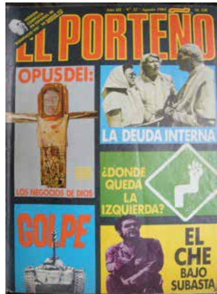
IMAGEN 5. El Porteño n° 32, agosto 1984