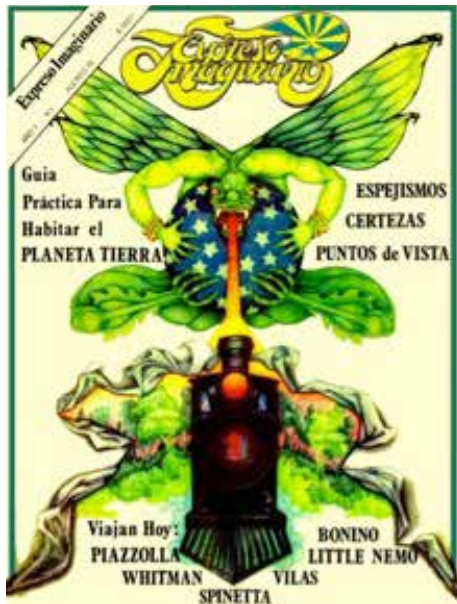
IMAGEN 4. El expresos imaginario n° 1, agosto 1976