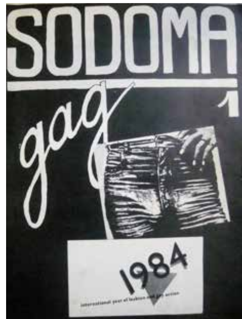
IMAGEN 7. Sodoma n° 1, 1984