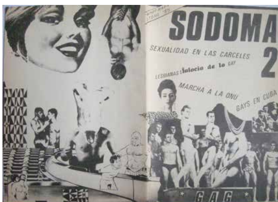
IMAGEN 9. Sodoma nº 2 , 1985