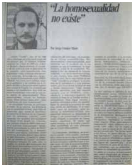
IMAGEN 6. "La homosexualidad no existe" de Jorge Gumier Maier, El Porteño n° 32, agosto 1984