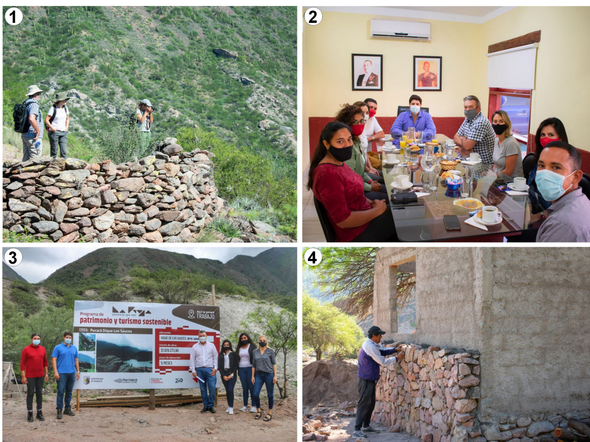
Figura 4. 1) Relevamiento del muro perimetral del Pucará de Los Sauces llevado a cabo por los miembros del PAS; 2) reunión de los integrantes del PAS, Intendente, Director y Secretarios de Cultura y Turismo; 3 y 4) construcción del ingreso y sendero cultural del Pucará.

Actualmente, el municipio a través del Programa de Patrimonio y Turismo Sostenible ejecutó en su primera etapa el proyecto de Pucará de los Sauces. El proyecto en ejecución contempla la construcción de un espacio de recepción, consolidado del sendero de acceso, descansos y cartelería específica. La señalética propuesta cuenta con 16 carteles con información general del sendero (grados de dificultad, altitud, tiempo estimado y kilómetros), normas de comportamiento para la conservación del sitio, cuidado ambiental y la descripción e historia del Pucará durante todo el recorrido (Figura 4). El PAS, además contempla capacitaciones sobre el patrimonio cultural de Sanagasta para el personal perteneciente a la municipalidad y agentes turísticos locales.