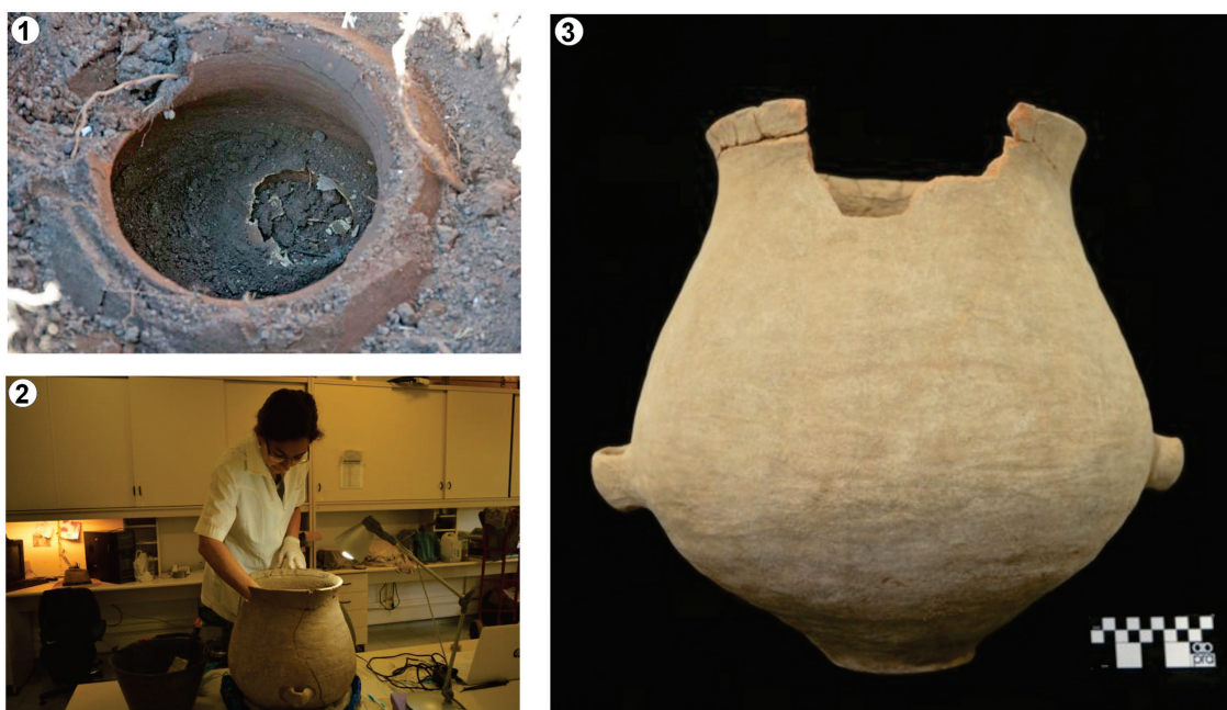
Figura 1. 1) Imagen del hallazgo de la urna funeraria; 2) trabajo de laboratorio; 3) urna funeraria reconstruida.

El PAS surge a partir de un hallazgo fortuito de una urna funeraria en la localidad de Huaco (departamento Sanagasta) en el año 2018, que implicó su rescate por el equipo técnico de la Subsecretaría de Patrimonio y Museo de la provincia de La Rioja y el grupo de Arqueología del Centro Regional de Investigaciones y Transferencia Tecnológica La Rioja (CRI-LAR-CONICET) para el análisis de los restos óseos humanos y la vasija cerámica (Figura 1).