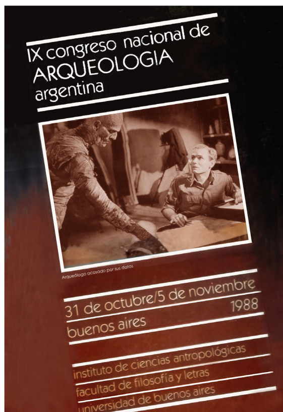
Figura 2. Poster del IX Congreso Nacional de Arqueología Argentina (Buenos Aires, 1988). La leyenda por debajo del fotograma de la película “ La Momia ” (Freund, 1932) reza: “Arqueólogo acosado por sus datos”.