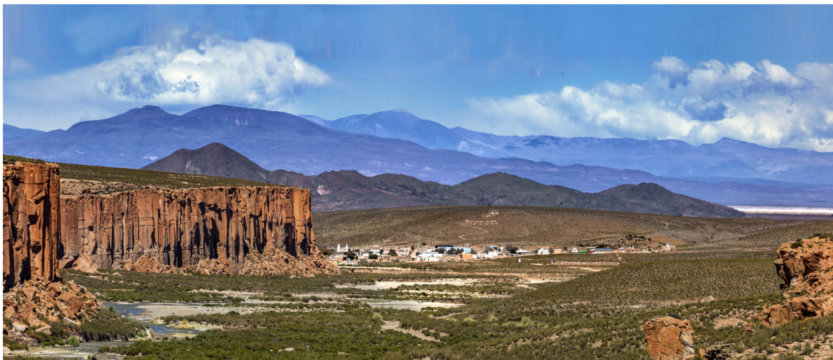
Figura 7. Vista, hacia el sur, del valle del río Barrancas, departamento Cochino, provincia de Jujuy. En primer plano se aprecian los paredones de ignimbrita de la margen izquierda del río; en la parte media de la imagen se observa la localidad de Barrancas o Abdón Castro Tolay y, al fondo (derecha), las Salinas Grandes.

jorar el techo de la casa, que estaba un poco caído. El proyecto generó interés en el gobierno de la provincia, a tal punto que mediante un crédito del BID 30 llevó a cabo la construcción, desde cero, del Centro de Interpretación Arqueológica de Barrancas, que se inauguró hace muy poco, en diciembre de 2020. Éste funciona, por un lado, como centro de interpretación arqueológica y, por el otro, como centro de reunión comunitaria, en el cual se dan charlas abiertas al público general. El Centro posee, también, un área de laboratorio y de depósito, que permite que analicemos los materiales después del trabajo de campo. En él, la gente del lugar puede visitarnos mientras llevamos a cabo nuestras tareas. Gracias al depósito, los materiales quedan todos allí, sin necesidad de que los transportemos a Buenos Aires para su estudio.