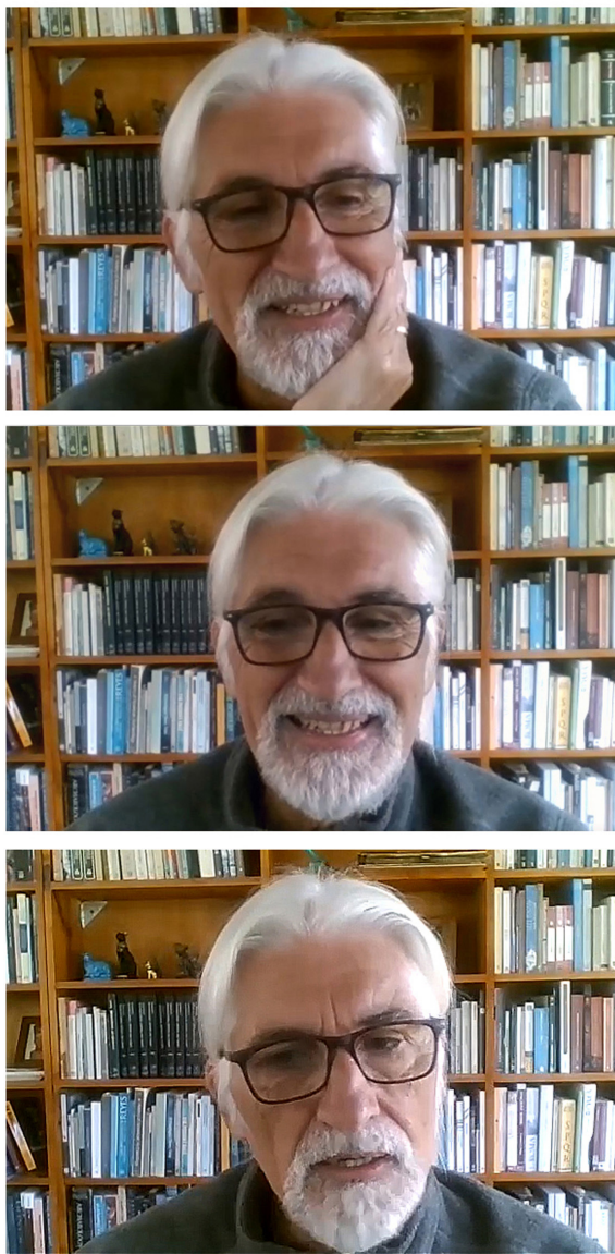
Figura 1. Diferentes momentos de la charla.