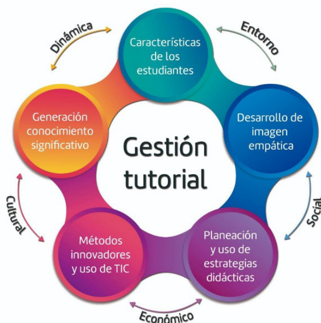
Figura 2. Modelo de Gestión Tutorial. *Tomado de Abrego, F. 19

Entonces, al realizar un análisis sobre la propuesta de este modelo, se contemplan algunos factores que tienen que ver con que los estudiantes cuentan con acceso a servicios básicos en sus hogares y en los ambientes en donde se desenvuelven, por lo que las planeaciones y propuestas de trabajo por parte del colectivo docente tienen que ir enfocadas al medio que los estudiantes están acostumbrados y empapados, pues el centro educativo no deberá quedarse rezagado de lo que los alumnos puedan vivir en sus hogares.