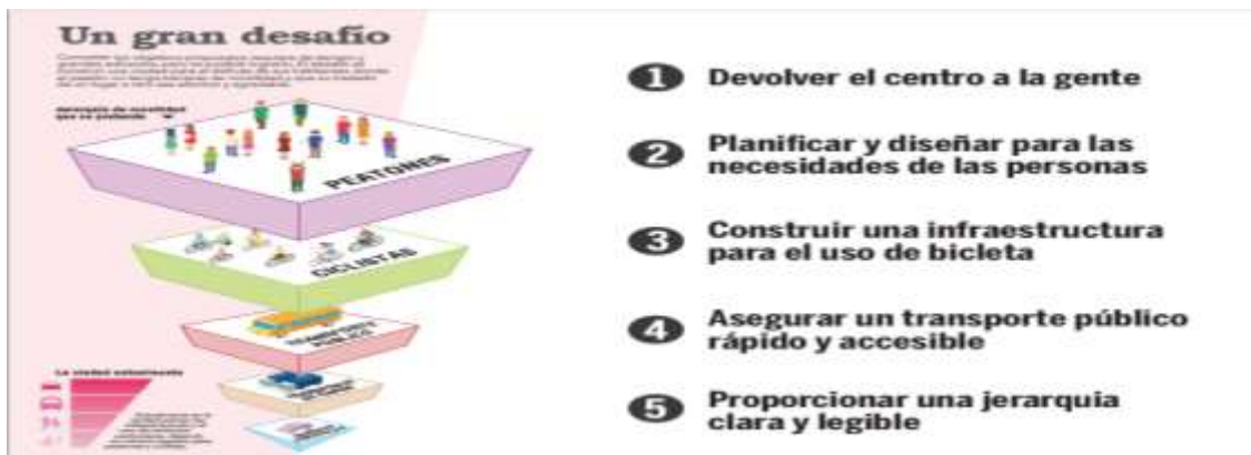
Figura 3. SISTEMA DE CONECTIVIDAD. PLAN CIUDAD