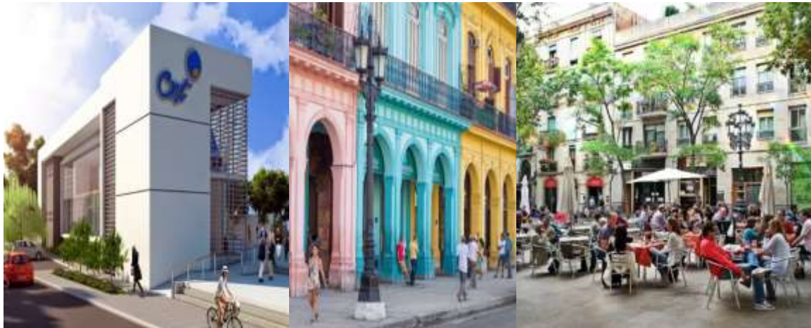
Figura 4. SISTEMA DE USOS DE SUELO. PLAN CIUDAD