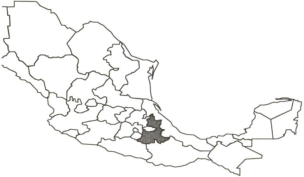
Fig. 1. Ubicación de la región estudiada