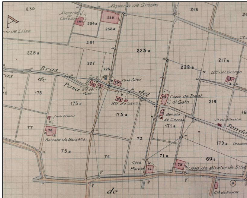
Figura 3. Detalle Polígono nº 4, Escala 1/2000, Catastrón del municipio de Alboraya, Valencia (España), 1930

Fuente: Archivo del Reino de Valencia; fotografía a color del original 13