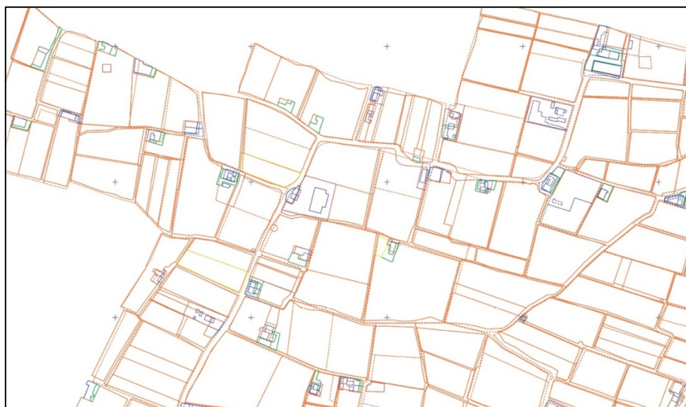
Figura 11. Imagen extracto superposición Catastrón-MTP (líneas discontinuas) con cartografía catastral actual (líneas continuas) en gvSIG; zona polígono nº 4, escala 1/2000, municipio de Alboraya, Valencia (España)