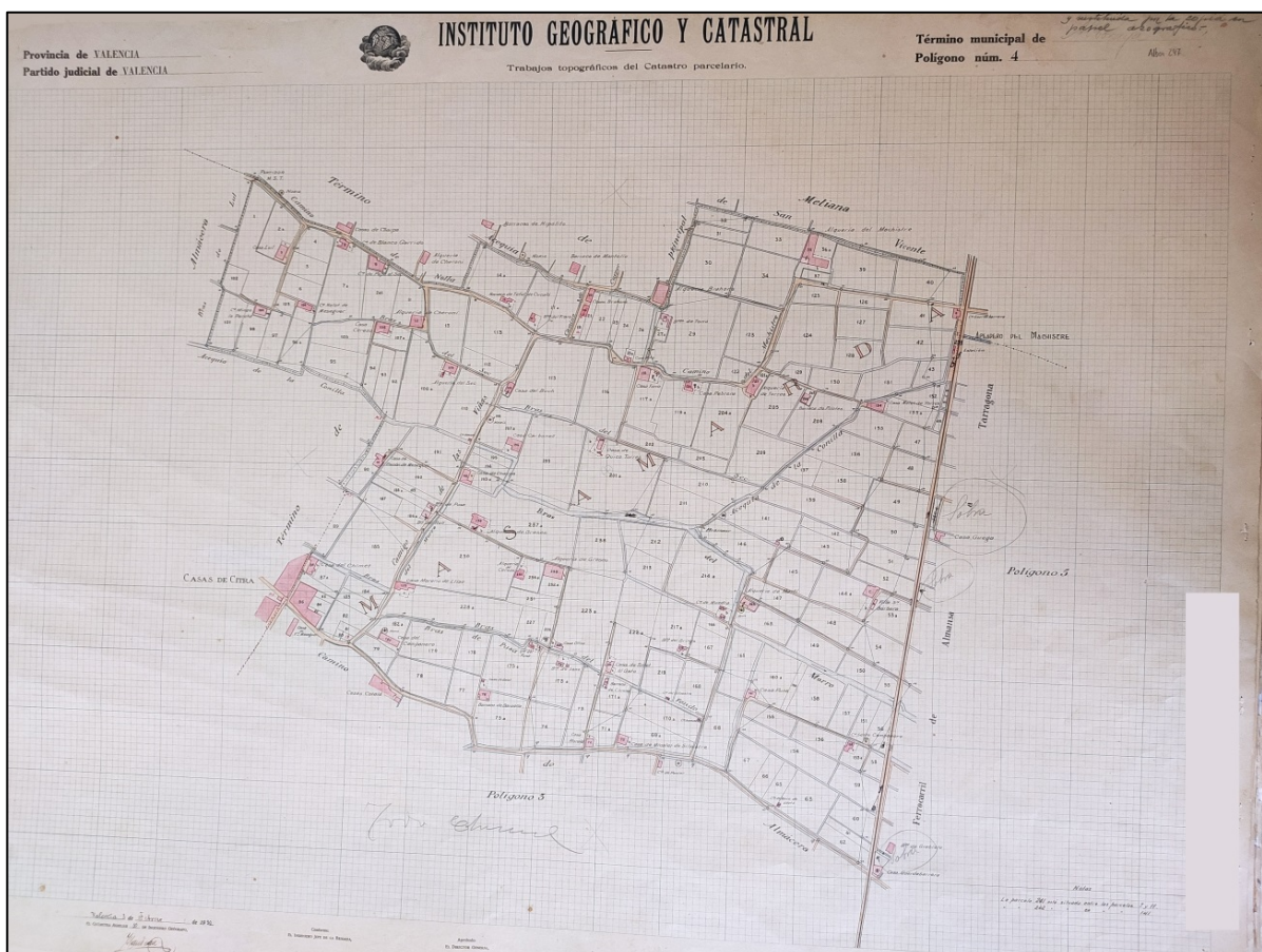
Figura 2. Polígono nº 4, Escala 1/2000, Catastrón del municipio de Alboraya, Valencia (España), 1930