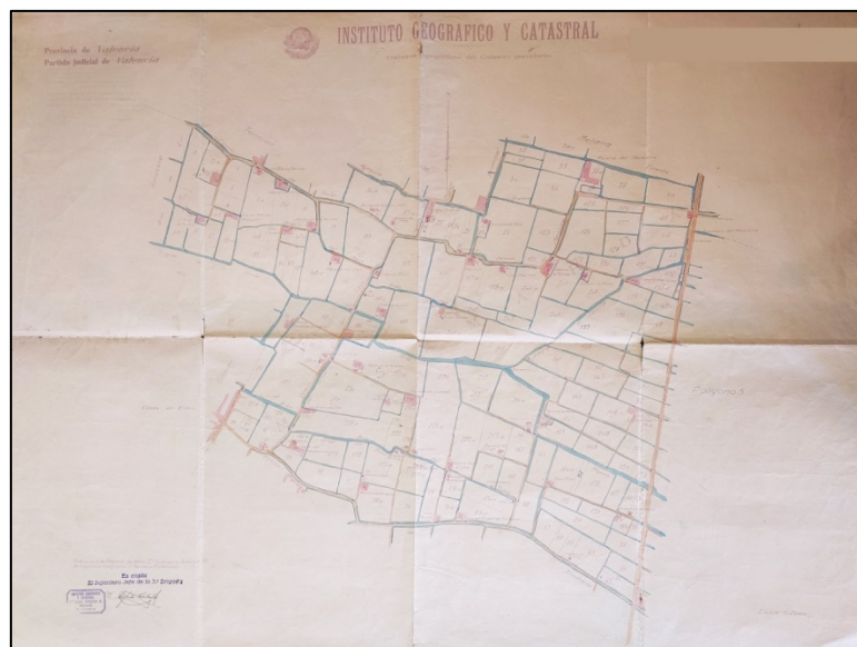
Figura 4. Polígono nº 4, Escala 1/2000, Mapa Topográfico Parcelario (MTP) del municipio de Alboraya, Valencia (España), 1930

Fuente: Archivo del Reino de Valencia; fotografía a color del original