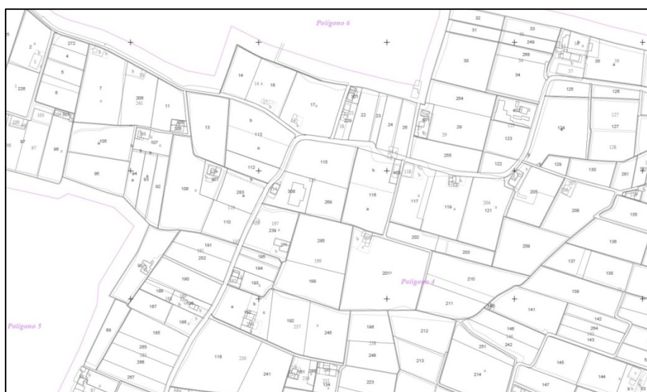
Figura 10. Superposición Catastrón-MTP (en gris) con cartografía catastral actual (en negro); zona polígono nº 4, escala 1/2000, municipio de Alboraya, Valencia (España)