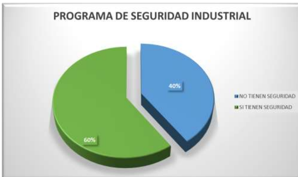
Gráfico 5 Empresa que han utilizado consultoría en Seguridad y salud en el trabajo