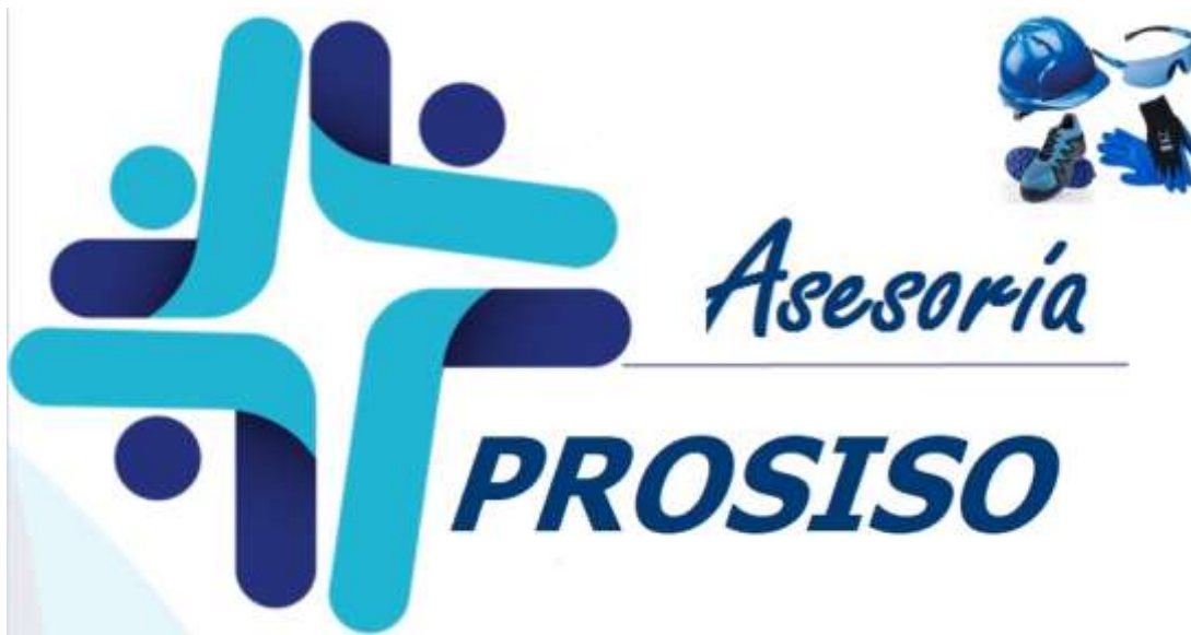
Grafico1. Logo PROSISO S.A.

El nombre de la empresa será PROSISO, se escogió el nombre por el significado de sus iniciales que están relacionadas con Favorecer (PRO), Seguridad (S), Industrial (I), Salud (S) y Ocupacional (O); es decir, será a favor de la Seguridad Industrial & Salud Ocupacional en el trabajo, que se implementaran con metodologías probadas a nivel nacional e internacional.