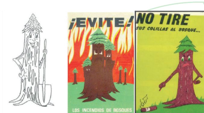
Figura 1. Primeros afiches para la prevención de incendios donde se muestran imágenes de especies exóticas, en 1969-1970.

Analizando las campañas de prevención de incendios desarrollados por CONAF desde 1965 a 2014, resalta cómo, aunque estas están dirigidas supuestamente a todo tipo de vegetación forestal o arbustiva y se usa el apelativo de “bosque”, en realidad estas están dirigidas a la protección del patrimonio de la actividad extractiva 6 . Por ejemplo, en los afiches de campañas de prevención de 1969-70 ( ver Figura 1 ), aparecen solo árboles similares al pino, sin imágenes relativas a otras especies arbóreas, arbustivas o agrícolas del sur de Chile.