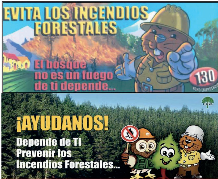
Figura 3. Campañas de CONAF y empresas forestales que aluden a la responsabilidad individual de los incendios forestales. En las imágenes se ve a Forestín y Silvestre, el búho que es imagen de la Corporación Chilena de la Madera (CORMA).