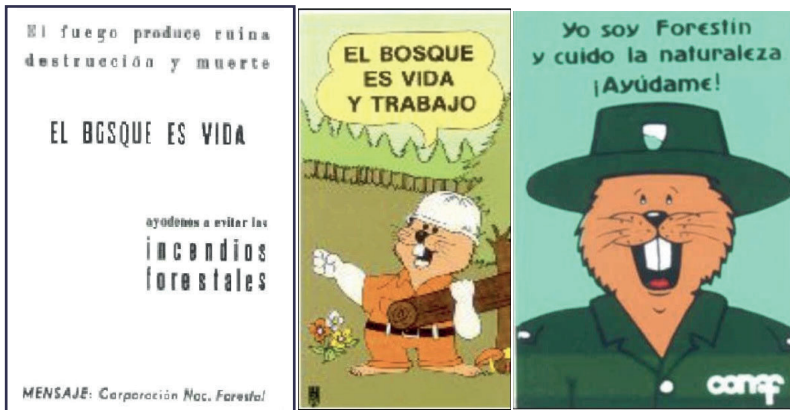
Figura 4. Imágenes de las campañas llevadas a cabo por CONAF y empresas forestales en que la prevención de incendios asociadas a valores ambientales o económicos y a igualdad entre bosque y plantaciones.