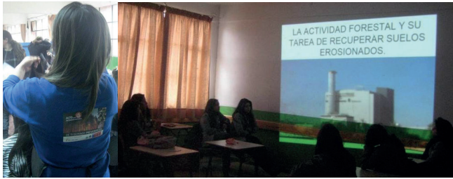
Figura 5. Fotografía de talleres de prevención de incendios desarrollados por WOF en Lota (Región del BíoBío). A la izquierda, en la espalda de la peluquera se lee el lema de la campaña “Alto a los incendios forestales, de ti depende prevenirlos”. A la derecha, un prevencionista explica las virtudes de la industria forestal y los peligros de los incendios para la población. Nota: Elaboración propia, 19.06.2014.

3. Intervención. La intervención directa de las empresas en las comunidades locales puede tener lugar en zonas con alta incidencia de incendios intencionales, donde los límites entre intervención y cooptación no son claros, como afirma el propio Jefe de WoF (25.02.2014):