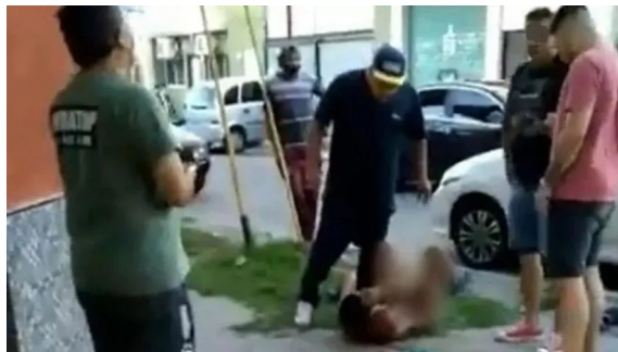
Imagen 5 Infocielo, 10/12/2020