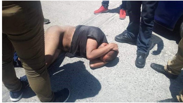
Imagen 3 Vía País, 03/01/2020.