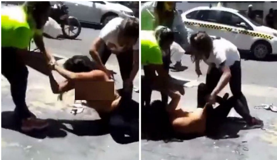
Imagen 4 El tribuno, 20/11/2020