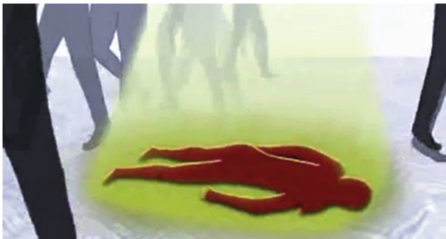
Figura 5. Captura del video “Convención Belém do Pará y su mecanismo de seguimiento” que muestra a una víctima/sobreviviente siendo iluminada