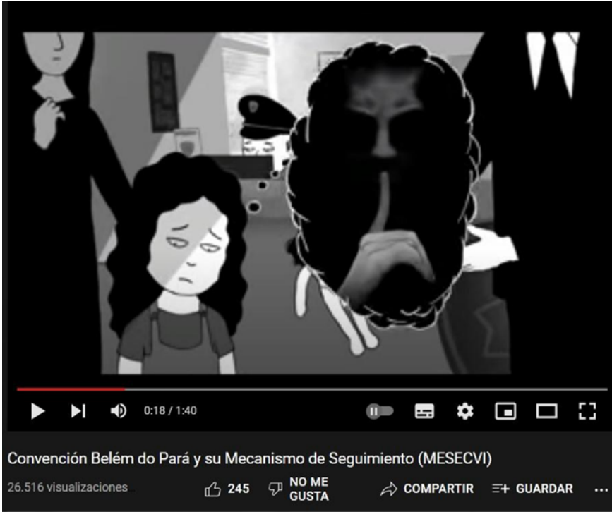
Figura 2. Captura del video “convención Belém do Pará y su mecanismo de seguimiento”