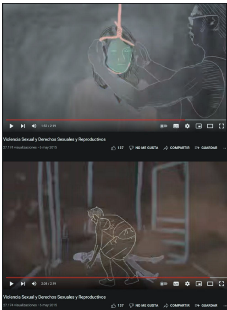
Figura 4. Capturas del video “Violencia sexual y derechos sexuales y reproductivos”