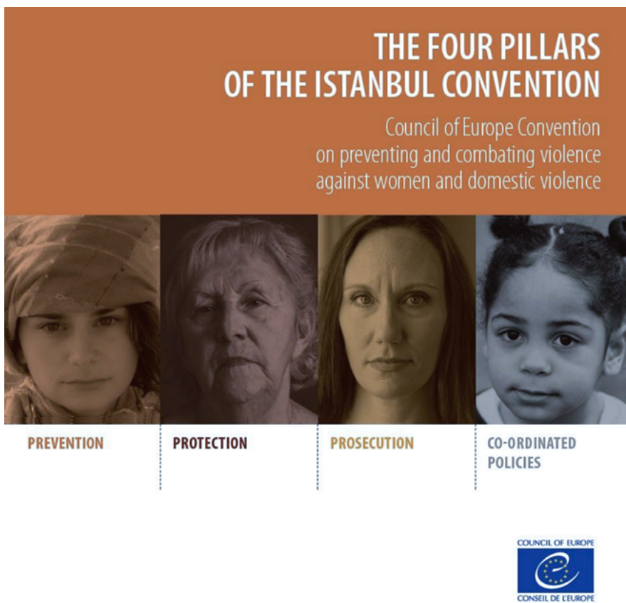
Figura 3. Portada del folleto “ The four pillars of the Istanbul Convention ”