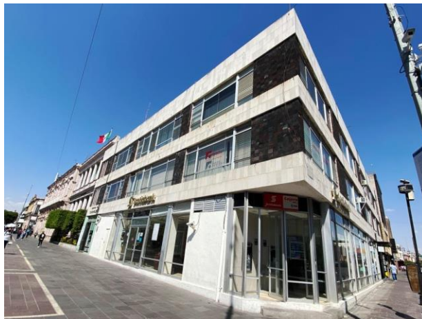
Figura 4. Edificio Racionalista en la esquina de Juan de Montoro y Plaza Patria. Constructora San Marcos. Piedra gris en faldones y pretil, distintiva de Aguascalientes.

En términos generales, estas son las codificaciones expresivo-formales más representativas en el México moderno, que creemos se presentan en diverso grado en Aguascalientes desde 1920 hasta 1970.