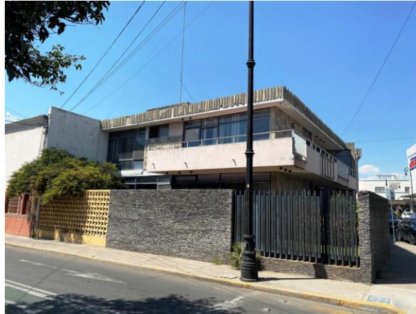
Figura 2. Inmueble Racionalista en la esquina de Juan de Montoro e Hidalgo. Arq. Ramón Ortiz Bernadac. Se observa la utilización de materiales como la piedra de rajuela negra, piedra laja y celosía de concreto de la región de Aguascalientes que constituyen una característica regional.