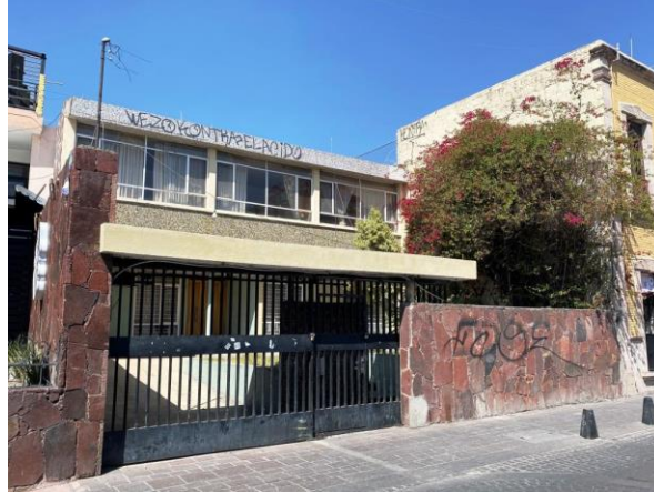
Figura 3. Residencia Racionalista en la calle Venustiano Carranza. Arq. Ramón Ortiz Bernadac. Utilización de piedra roja y azulejo "veneciano" en muros, particularidades locales.