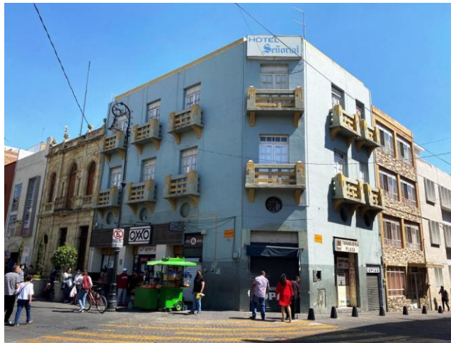
Figura 1. Finca Art Déco en la esquina de Juan de Montoro y Colón en el Centro Histórico. Constructor anónimo. Aplanado de cemento en muros y celosía prefabricada en balcones, propios de Aguascalientes.

Sin lugar a duda la diversidad en la construcción de edificios en el centro de Aguascalientes sujeta a procesos de asimilación-adaptación paulatina tiene la propiedad de establecer un progresivo conjunto de significantes, y que al mismo tiempo, es debido a las inercias de ocupación de sus espacios públicos dependientes de las funciones, actividades y factores de habitabilidad. Ver Figura 1.