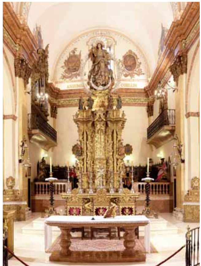
VISTA GENERAL DEL PRESBITERIO CON EL RETABLO MAYOR O TABERNÁCULO.