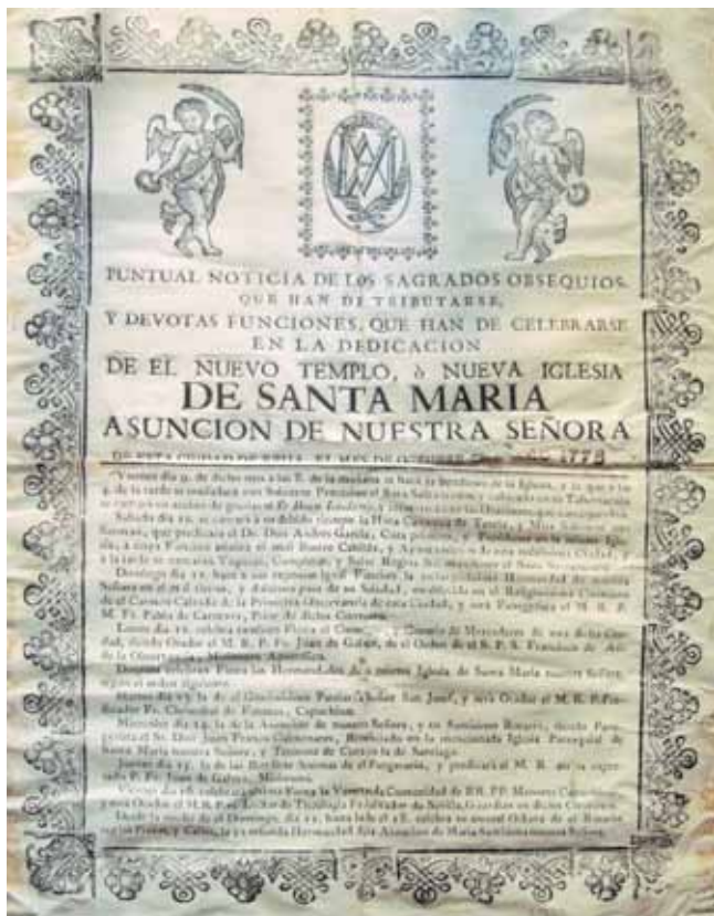
PUBLICACIÓN CONMEMORATIVA DE LA INAUGURACIÓN DEL TEMPLO EN 1778.