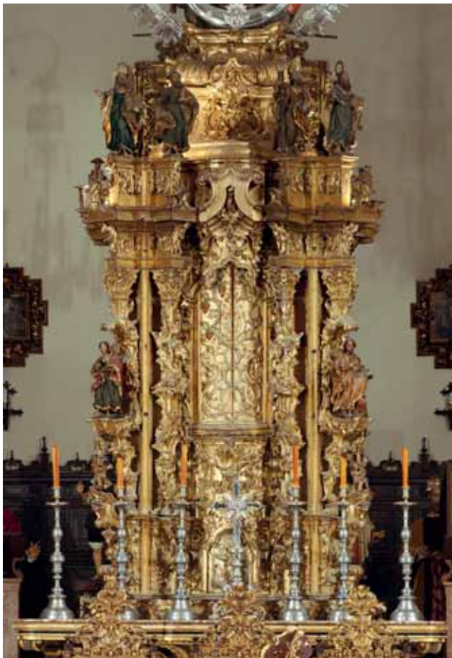
VISTA DE LA PARTE FRONTAL DEL RETABLO O TABERNÁCULO.