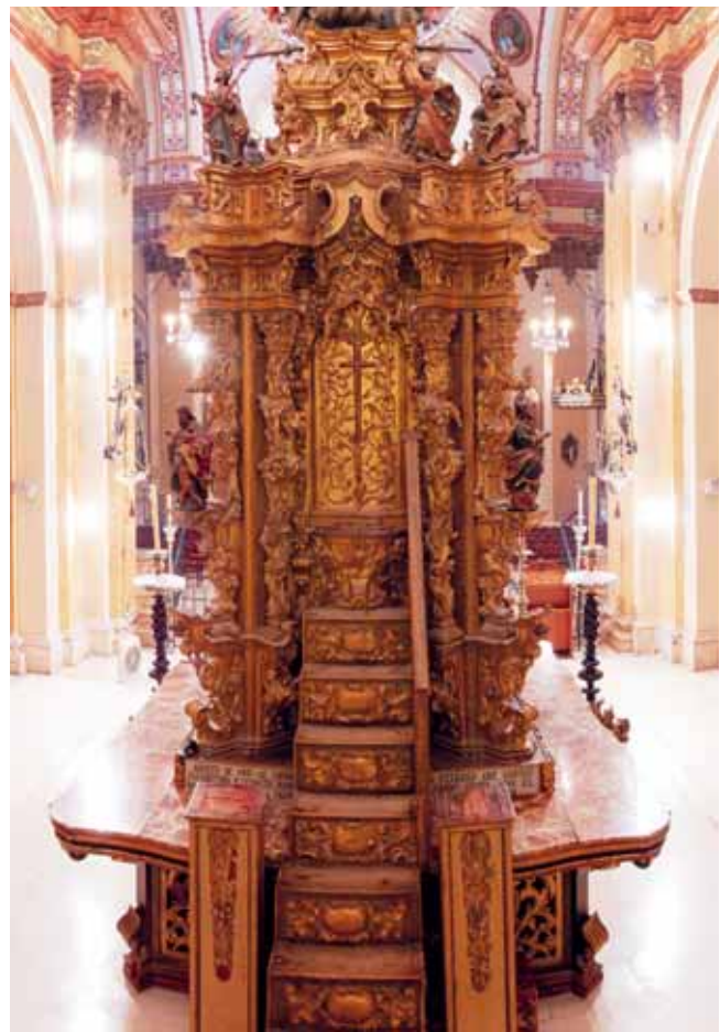
VISTA DE LA PARTE TRASERA DEL RETABLO O TABERNÁCULO.

alhajas de la iglesia del exclaustro de San Fulgencio, entre ellos la llamada «Pira», con la idea de que hiciera las veces de retablo mayor en el nuevo presbiterio o en la capilla sacramental.