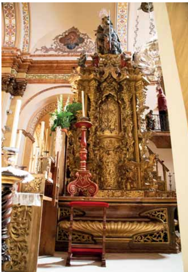
VISTA DEL LATERAL DE LA EPÍSTOLA DEL RETABLO O TABERNÁCULO.