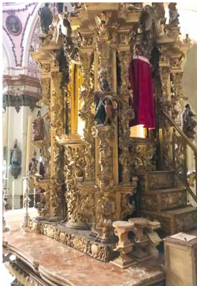
VISTA DEL LATERAL Y TRASERA DEL TABERNÁCULO.

similares es la caja del órgano de esta misma parroquia, obra de Antonio González Cañero, entregada el 4 de febrero de 1761 22 , así como el órgano de la iglesia parroquial de Santiago. Esta similitud estilística y decorativa podemos encontrarla en otros bienes muebles distribuidos por iglesias parroquiales y conventuales ecijanas 23 .