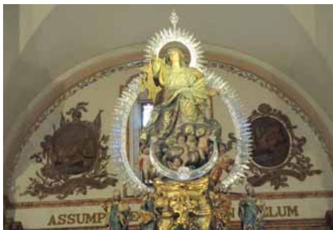
VIRGEN DE LA ASUNCIÓN, PROCEDENTE DEL ANTIGUO RETABLO.

según avisa el mayordomo componer el retablo del altar mayor del sagrario nuevo que se adquirió de los jesuitas, que por razón de dicha obra ha estado sin uso, poner con la correspondiente decencia la titular Nuestra Señora de la Asunción, que se haya al descubierto, y por esta causa indecente... 34