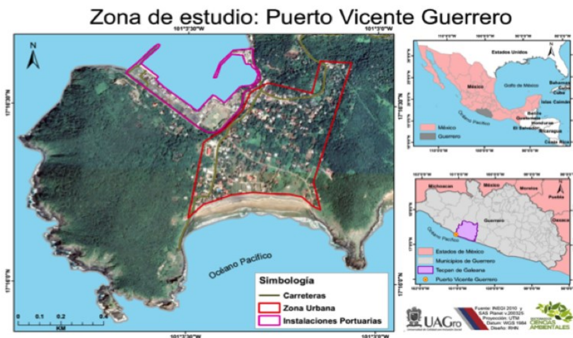
Figura 1. Infraestructura del Puerto Vicente Guerrero, Municipio de Tecpan, Guerrero, México

Puerto Vicente Guerrero se encuentra en el municipio de Tecpan de Galeana, en el estado de Guerrero, a una altitud de 71 metros sobre el nivel del mar. Sus coordenadas geográficas son Longitud: 17° 16' 13", Latitud: -101° 03' 22". La localidad se ubica a 48 kilómetros de la ciudad de Tecpan de Galeana, en dirección norte hacia Ixtapa-Zihuatanejo, a una distancia de 87 kilómetros de esta última (Figura 1). El nombre "Puerto Escondido" se debe a su peculiar ubicación, enclavada entre el mar y las montañas (Giovannelli, 2009) (ver Figura 1). La población de la localidad es de 413 habitantes, con un 50.84% de hombres y un 49.16% de mujeres, distribuidos en 207 viviendas según datos del INEGI en 2010.