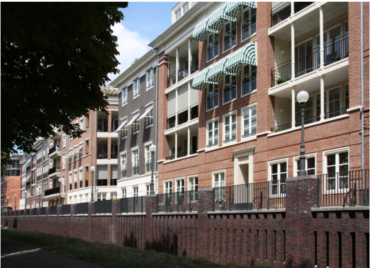
View of the complex and walkway | Vista del complejo y del paseo | Vista do complexo e do passeio

The garages in the complex serve as multipurpose spaces, providing storage and bicycle parking. The apartments vary in size, ranging from compact 70 m 2 units to more spacious 200 m 2 homes, with most being about 85 m 2 . The garage level is slightly below ground level and the building is a considerable 243 meters in length, with six stories in