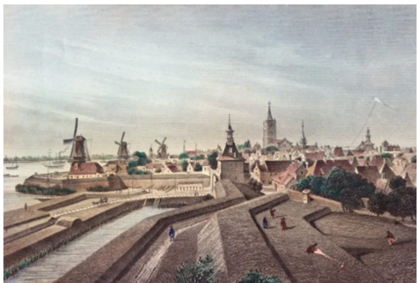
Engraving by Georg Michael Kurz after a drawing by Christian Schüler, 1855 | Grabado de Georg Michael Kurz a partir de un dibujo de Christian Schüler, 1855 | Gravura de Georg Michael Kurz a partir de um desenho de Christian Schüler 1855 (Private collection)

O centro histórico de Gorinchem tem um contraste cativante na sua escala e ambiente. Fora das suas fortificações, a grande magnitude do rio, do vento e dos navios que passam. No entanto, dentro das muralhas fortificadas, os elementos predominantes são os pitorescos telhados inclinados de pequenas dimensões e as ruelas sinuosas. Esta mistura harmoniosa de escalas pode ser vista na gravura de Georg Michael Kurz, com um papagaio a ser lançado do ponto mais alto das muralhas, e com um efeito característico através do qual todas as vistas ao nível do solo, do centro da cidade para a paisagem circundante, são discretamente obstruídas. Um dos passatempos locais favoritos é passear ao longo das fortificações, que oferecem vistas deslumbrantes sobre o rio. A zona de Den Haan estende-se ao longo da muralha conhecida como Courtine, enquanto o Zevende Bastion está situado no próprio bastião.