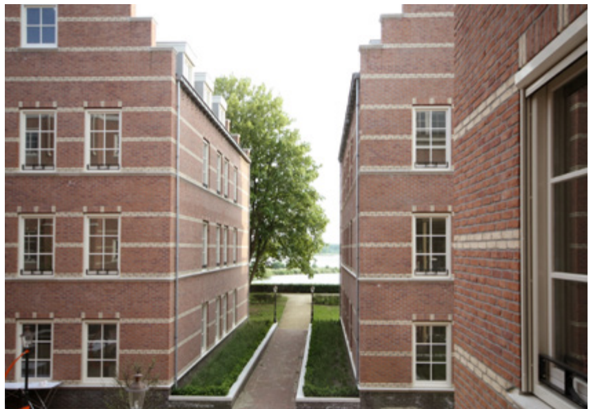
Intimate public spaces | Espacios públicos íntimos | Espaços públicos íntimos

Within the site, the ensemble comprises four houses, a corner store, and a corner tower. As one moves toward the river, a larger scale takes precedence, with military nuances evident in the architectural details. The facade design draws inspiration from local features from the fifteenth and sixteenth centuries, with elements such as colored bands in the brickwork and stepped gables. The distinctive color palette adopted, inspired by nearby historic buildings, appears in the bricks, painted steel, and concrete.