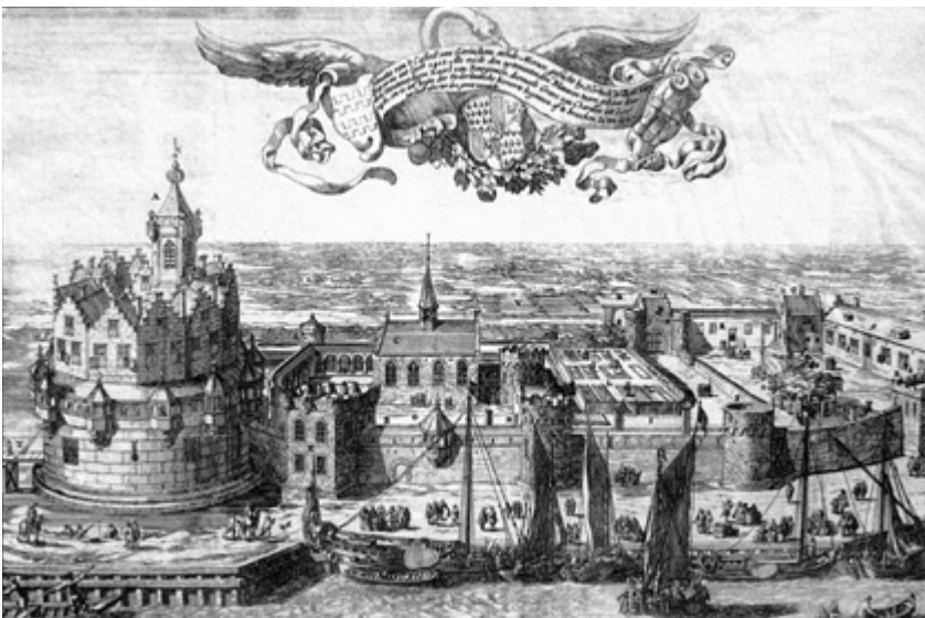
Drawing of Gorinchem's Blue Tower Castle by Jacob van Ulft | Dibujo del Castillo de la Torre Azul de Gorinchem por Jacob van Ulft | Desenho do Castelo da Torre Azul de Jacob van Ulft