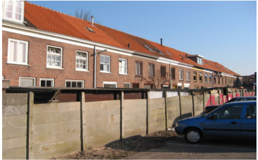
The second court, before and after | El segundo patio, antes y después | O segundo pátio, antes e depois