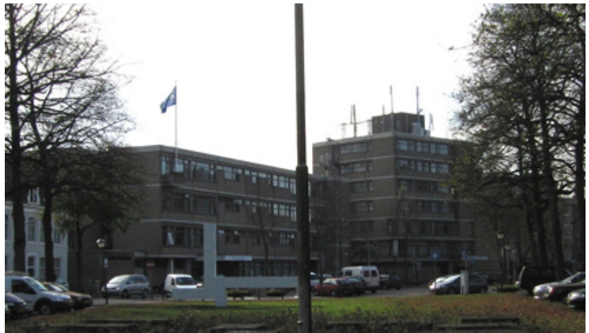
The former hospital and our project | El antiguo hospital y nuestro proyecto | O antigo hospital e o nosso projeto

extensão de água povoada por pássaros e rodeada de prados, com uma vista panorâmica em constante evolução. O outro lado do terreno está perfeitamente integrado no tecido urbano, oferecendo vistas sobre o Kalkhaven, um canal que foi preenchido por volta de 1870.