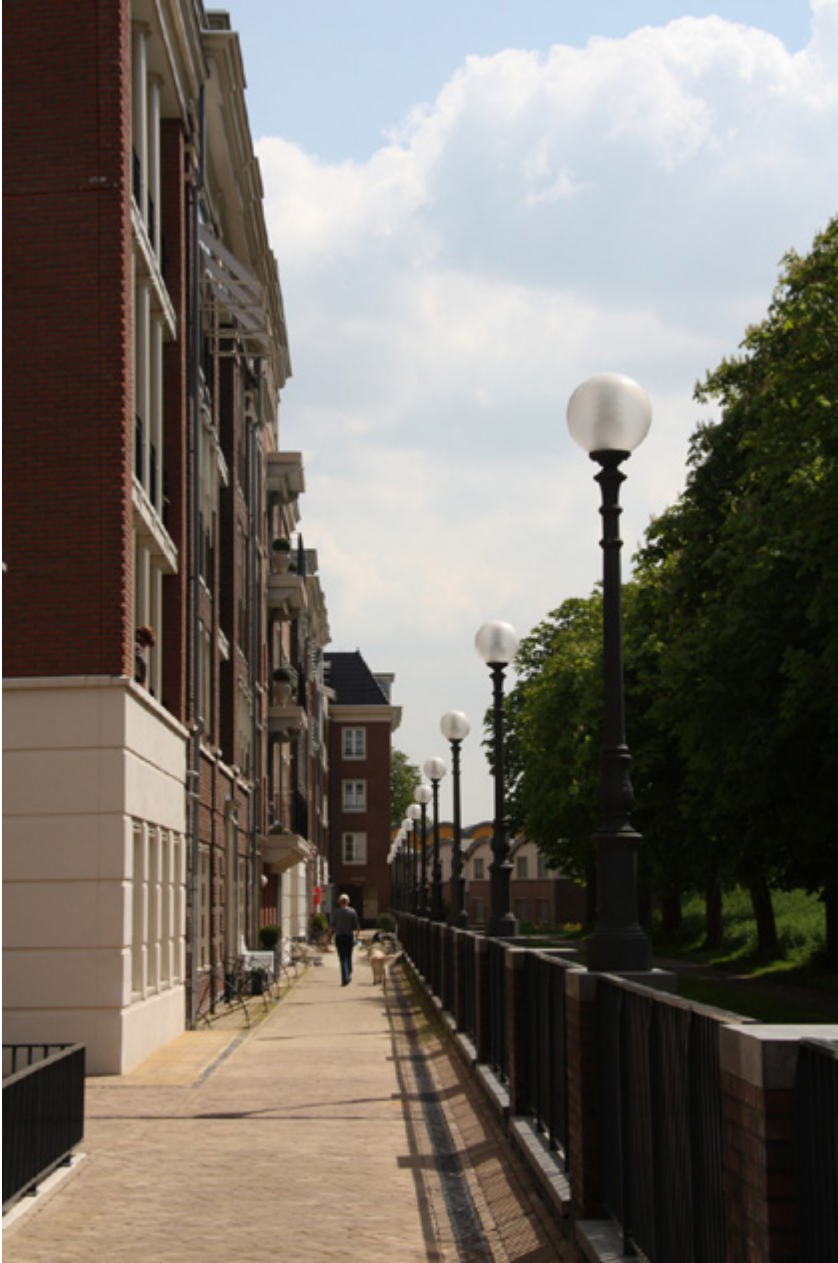
Walkway over the parking garage | Paseo sobre el aparcamiento | Passeio no topo do parque de estacionamento

The existing Torenstraat was extended to the city wall, with an ensemble of 12 houses. In place of the former entrances on Pompstraat, the townhouses were integrated into the urban landscape. The four buildings designed by Scala Architects were developed to embody their residential character, collectively forming a harmonious family of nine distinct members. The corner building, positioned between the Courtine and the street, has a dual role, as an additional row of houses and as a mansion.