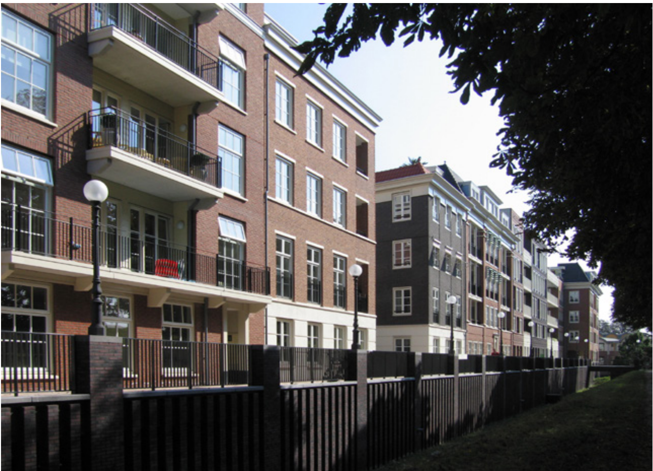
Facade balconies | Balcones de fachada | Varandas nas fachadas

O pedido do promotor de incorporaco de varandas nas fachadas levou à incluso de vrios elementos de design, incluindo lgias e uma estrutura em consola. O projeto da Scala Arquitetos baseou-se na simplicidade das tradies arquitetnicas locais. Ao contrrio de outros discursos com tradies de colunas e ordens, a linguagem clssica holandesa  caracterizada por uma forte nfase nas propores da fachada, aberturas de janelas, entradas elaboradas, rodaps e caleiras. A utilizao de uma sacada, uma modesta projeo da fachada,  uma caraterística predominante nos Países Baixos e desempenha um papel importante na obteno de um exterior bem proporcionado.