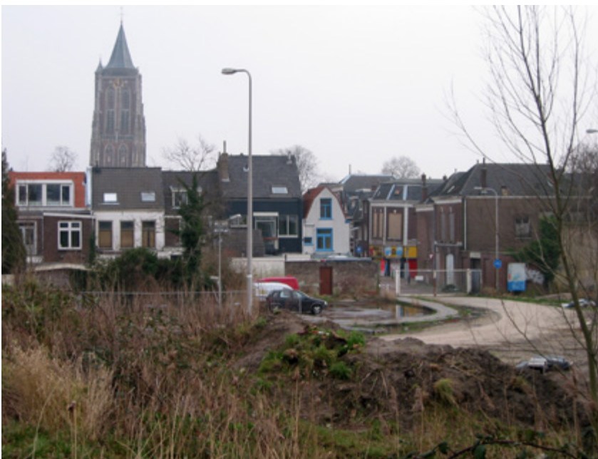
Wasteland on the Den Haan site, 2004 | Terrenos baldíos en Den Haan, 2004 | Zona de Den Haan, terreno baldio 2004