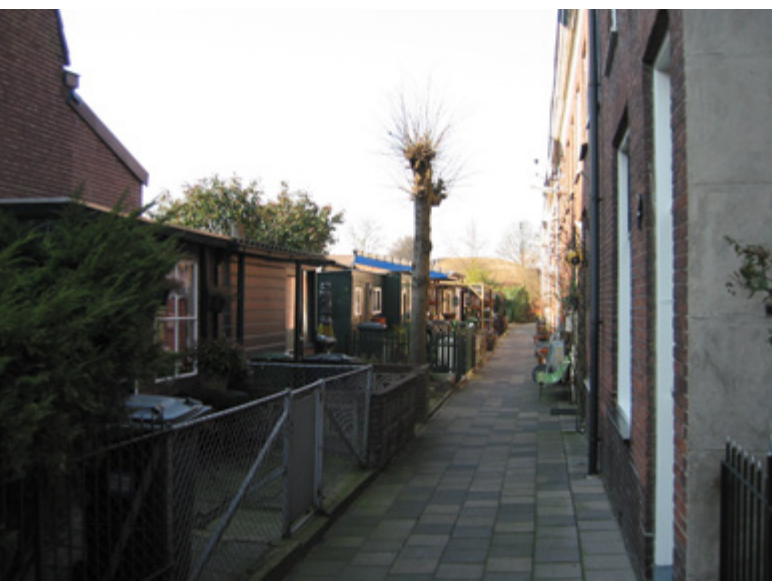
Lion Court | Patio de los Leones | Pátio dos Leões

Um estudo do traçado urbano local destacou o caráter único do Pátio dos Leões adjacente. À primeira vista, pode parecer uma rua sem saída. Não existem ruas públicas; em vez disso, cada lote é privado e cada habitação tem o seu próprio jardim e uma cabana do outro lado da rua. Esta área funciona como um espaço de jardim partilhado pelos residentes, embora não tenha reconhecimento oficial e, de facto, os residentes habituaram-se a viver aqui em comunidade, ao ponto de