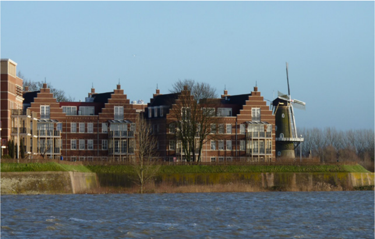
Zevende Bastion with windmill | Zevende Bastion con molino de viento | Zevende Bastion com moinho de vento