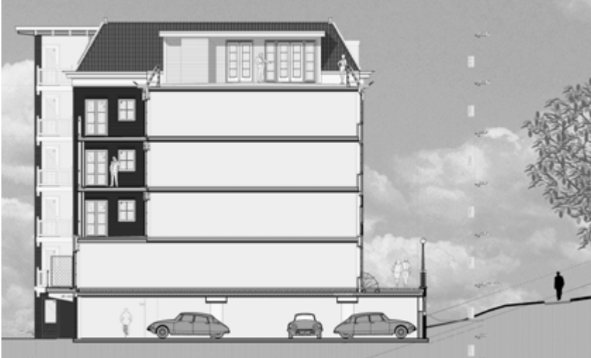
< Section of the apartments along the Den Haan ramparts | Sección de los apartamentos junto a los terraplenes de Den Haan | Secção dos apartamentos junto aos terraplenes de Den Haan