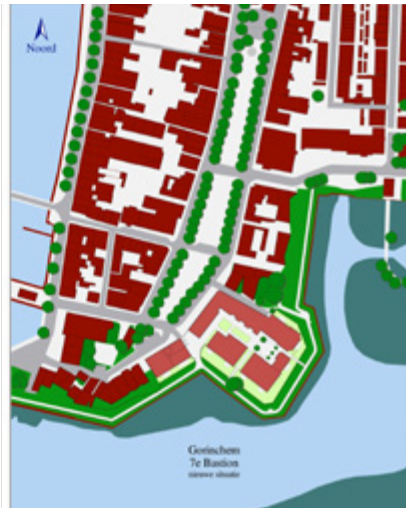
< 7th Bastion site layout, before and after | Disposición del 7º Bastión, antes y después | Esquema urbano do 7º Bastião, antes e depois