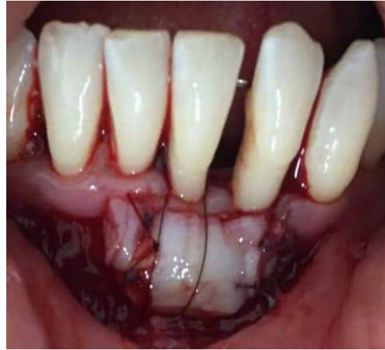
Figura 6. Colocación del injerto gingival libre en el lecho receptor.

Se realiza control a los 8 días, en el cual no hay signos de infección ni inflamación, puntos en posición, los cuales se deciden mantener por 7 días más, en el siguiente control se retiran puntos de sutura. En el control en las siguientes 20 semanas, se observa un buen proceso de cicatrización y se logra un buen grado de cobertura radicular (figura 7).