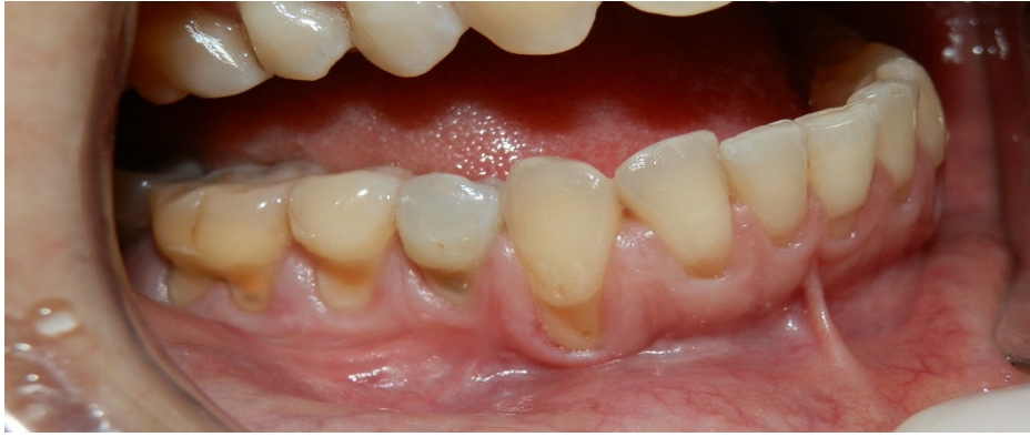
Figura 2. Dientes posteriores inferiores con recesos gingivales tipo Miller clase II y III.

Nos reunimos con la paciente, a quien le explicamos en detalle las implicaciones, ventajas y desventajas de este tratamiento, así como posibles alternativas al mismo. Luego de hablar con ella y solo después de que firmó un consentimiento informado, procedimos a realizar la intervención.