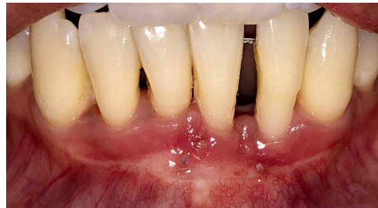
Figura 7. Control postoperatorio a los cinco meses, se logró cobertura radicular parcial.