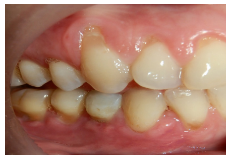
Figura 4. Control postoperatorio a los 3 meses, se observa la mejoría en la recesión gingival.

Se realiza control a los 8 días, no hay signos de infección ni inflamación, puntos en posición, los cuales se retiran a los 15 días, por otro lado, se dan recomendaciones al paciente para mejorar la técnica de cepillado. En control a las 12 semanas se observa buen proceso de cicatrización y evidente mejoría de la recesión gingival, con mejoría de la hipersensibilidad dentaria (figura 4).