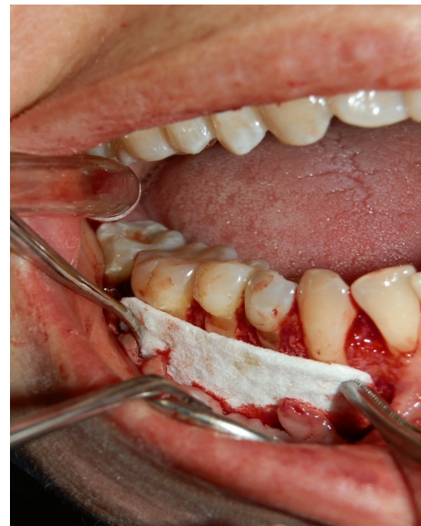
Figura 3. Colocación de la membrana dérmica celular en el sector posteroinferior para solucionar el defecto.

Finalmente, se sutura individualmente con 5/0 ácido poliglicólico. El injerto no debe exponerse ni extenderse a los lechos vasculares a nivel papilar ni coronalmente a cada una de las uniones cemento-esmalte.