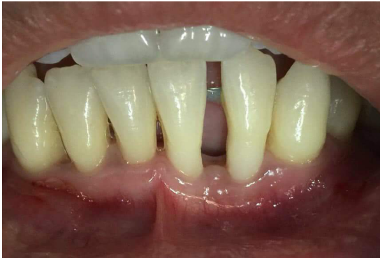
Figura 5. Órganos dentarios anteroinferiores con recesiones gingivales tipo Miller clase II y III.

Paciente femenino de 21 años de edad, con buen estado general y sin alteración sistémica alguna, que acude a consulta por motivos estéticos en sector anteroinferior izquierdo a nivel de los dientes 31 y 32, al examen intraoral se observa recesión gingival tipo Miller II y III, con un frenillo labial inferior corto, por lo que se decidió realizar injerto gingival libre y frenilectomía labial inferior para aumentar el espesor del tejido queratinizado.