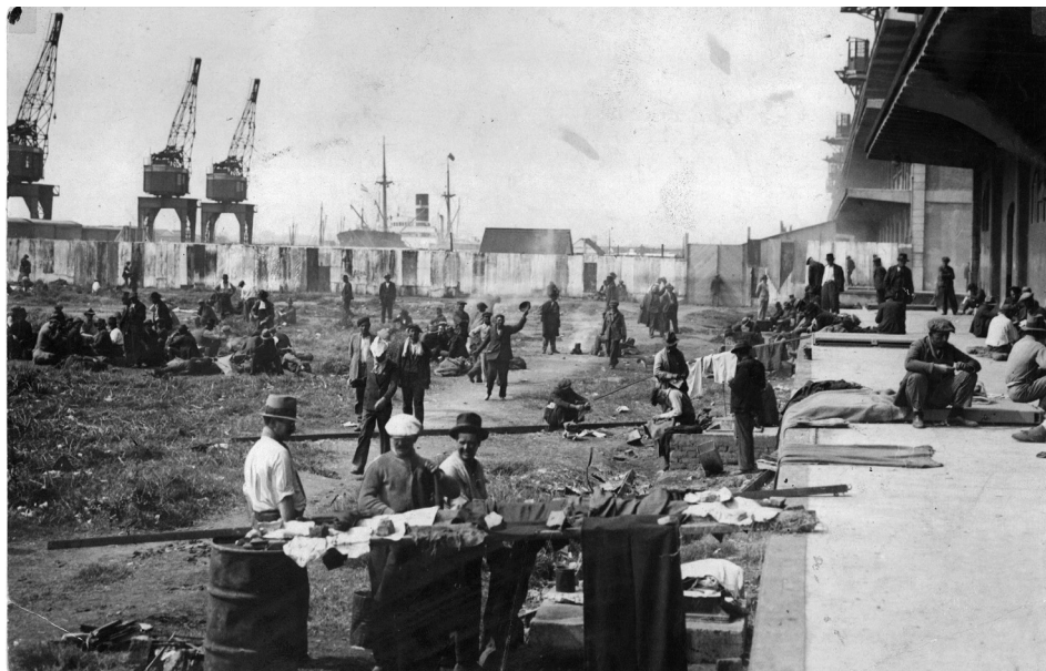
Figura 1: Desocupados en Puerto Nuevo, 1932.