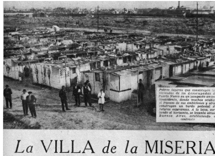
Figura 6: Si bien la expresión "villa miseria" se popularizó hacia mediados del siglo XX, bajo la Gran Depresión ya se empleaban términos similares.