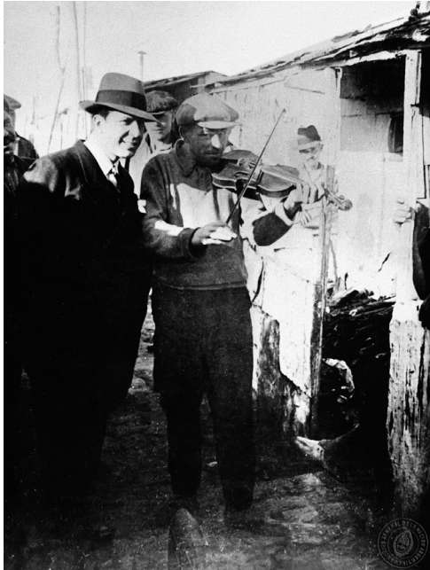
Figura 5: Carlos Gardel en Villa Desocupación, octubre de 1933.