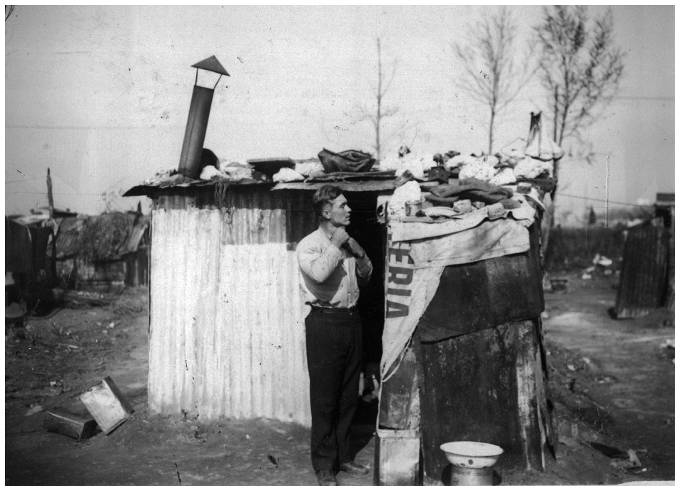
Figura 2: Desocupado en el bajo de Palermo, agosto de 1932. Fuente: Archivo General de la Nación, Departamento de Documentos Fotográficos, Inventario n.º 73.894.