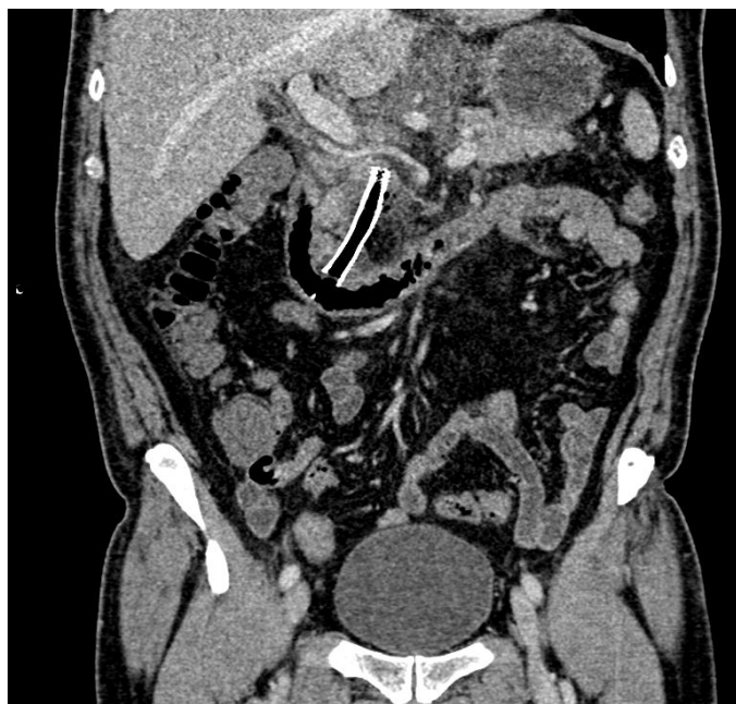
Figura 1 TC abdominal. Imagen coronal que ilustra la malposición de la prótesis biliar ajena al marco duodenal y burbujas de neumorretroperitoneo.

Varón de 68 años, con el único antecedente de coledoclitiasis sintomática, al que se le realiza una colecistectomía laparoscópica programada sin colocación de drenaje intraabdominal. El paciente reingresa 72 horas después por dolor y distensión abdominal sin fiebre ni leucocitosis en la analítica. Se realiza una colangiografía resonancia magnética en la que se aprecia moderada cantidad de líquido libre perihepático y en el lecho de la colecistectomía sin colecciones organizadas y sin coledocolitiasis, que dada la cirugía reciente establece la sospecha de fuga biliar. El paciente es reintervenido por vía laparoscópica confirmándose la existencia de coleperitoneo por una fístula biliar a nivel de la desembocadura del conducto cístico en el colédoco. Se realiza sutura, lavado y colocación de un drenaje intraabdominal. Postoperatoriamente persiste una fístula biliar de alto débito que es tratada con esfinterotomía endoscópica y colocación de una PB por CPRE. Tras una pancreatitis aguda no complicada con evolución favorable, es dado de alta el 25º día postoperatorio con resolución de la fuga biliar. Acude una semana después a urgencias por dolor abdominal, fiebre, con signos clínicos de sepsis y en la analítica leucocitosis (14,93x10 3 µl) y una PCR de 23,81 mg/dl. Se realiza una tomografía computarizada (TC) abdominal que