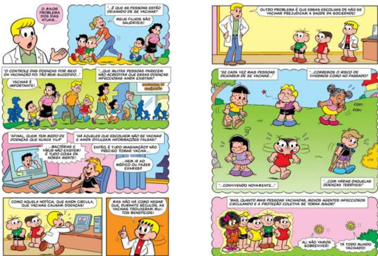
Figura 2 – Vacina e Fake News