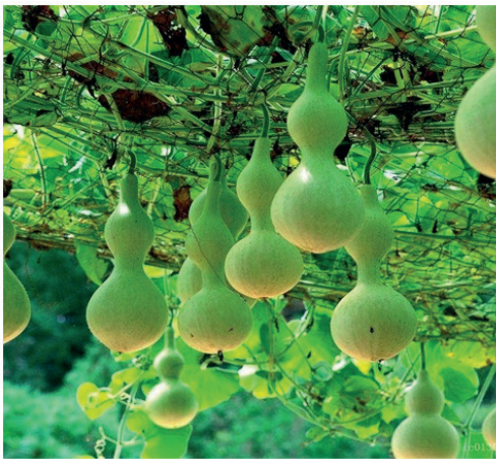
Figura 1. Anónimo (2020) https://buenaondamate.com/es/lagenaria-siceraria/ , Ejemplo de planta lagenaria

Quizás el instrumento que más destaque dentro de las construcciones de ambos investigadores sea el Zulivo. Su construcción se basa del cuerpo de dos calabazas junto con la unión de un soporte de plástico y uniendo a esto seis cuerdas afinables. Esta inspirado en el berimbau 2 y usa la misma técnica.