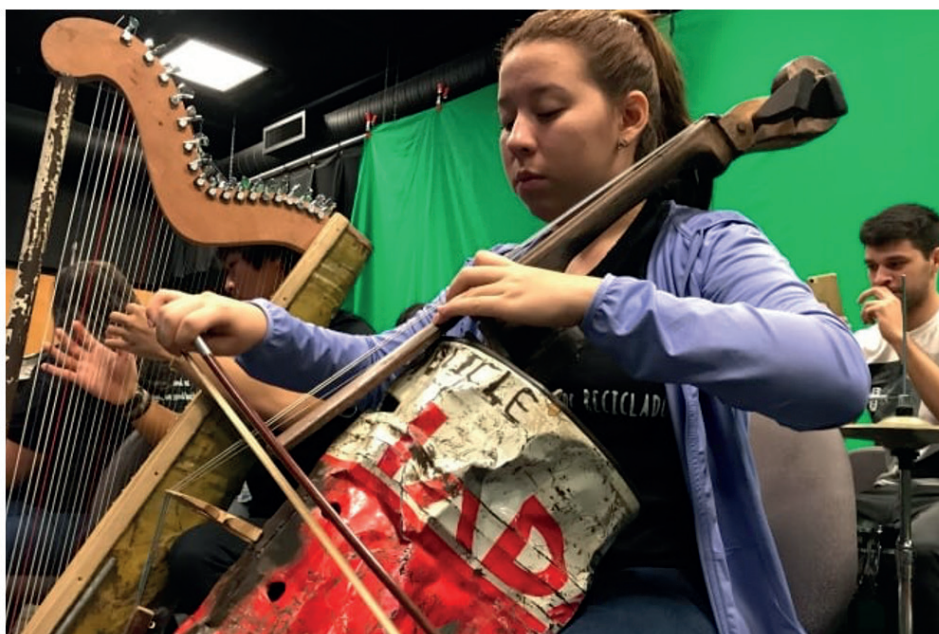
Figura 4. (2018) https://www.cbc.ca/news/canada/saskatchewan/landfill-harmonic-orchestra-performing-regina-1.4681331 , Componente de LandFill Harmonic Orchestra .

Este proyecto cuenta con multitud de beneficios como es la conciencia de reciclar, la ayuda para alejar la delincuencia a los jóvenes de la ciudad. Gracias al dinero que recaudan pueden ayudar a las familias a arreglar sus casas y darle alimento.