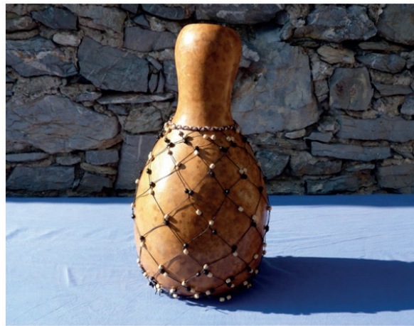
Figura 2. Raimondo https://www.artigianodel-suono.com , Shekere construido por el autor.