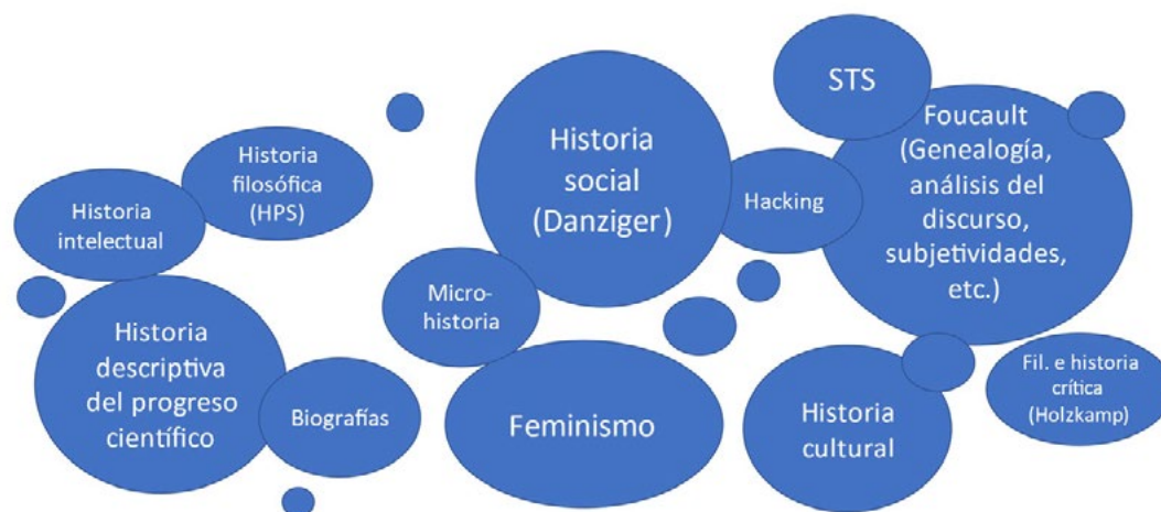
Figura 2. Algunos enfoques historiográficos de la actualidad

El esquema no incluye todos los estilos historiográficos en historia de la psicología. Faltarían, por ejemplo, la historiografía del psicoanálisis y la psicohistoria.