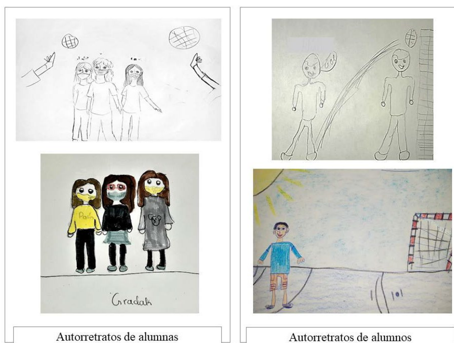
Figura 3. Ejemplos de los resultados del Centro 3. Dibujos realizados por participantes de 10 años.

mientras que el 80% de las niñas se muestra en una postura estática o pasiva. La presencia del campo de fútbol también es notable (aparece en el 67% de los dibujos de los niños y en los 80% de los dibujos de las niñas), y es reseñable que la mitad de las niñas se dibuja a sí misma como observadora pasiva en las gradas, mientras que ningún niño lo hace. Otro dato característico es que dos de las niñas se representan como sujetos intimidados durante el recreo, y a pesar de que no forma parte de la consigna, la mitad de las niñas escriben algo en el dibujo haciendo referencia a sus sentimientos, y por el contrario solo uno de los 16 participantes-niños hace lo mismo.