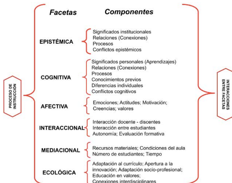
Figura 1. Facetas y componentes del proceso instruccional que pueden ser focos de la investigación.

Cada faceta se puede valorar con criterios generales referidos a cada componente que se define como una “norma de corrección