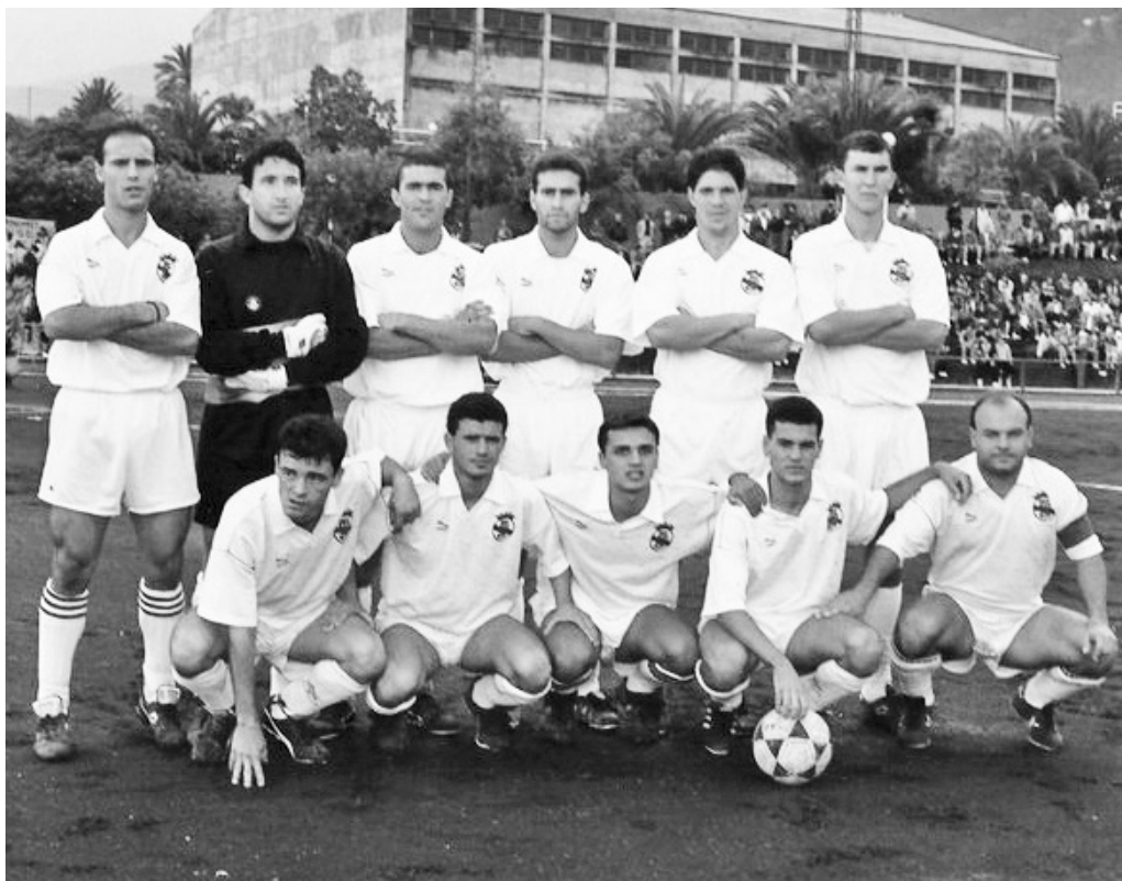
Los jugadores de la S. D. Tenisca posan en el Estadio Insular de Miraflores con el graderío lleno [SDT]