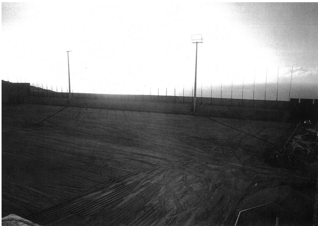
Fase final de la construcción del Estadio Virgen de las Nieves, temporada 1997-1998