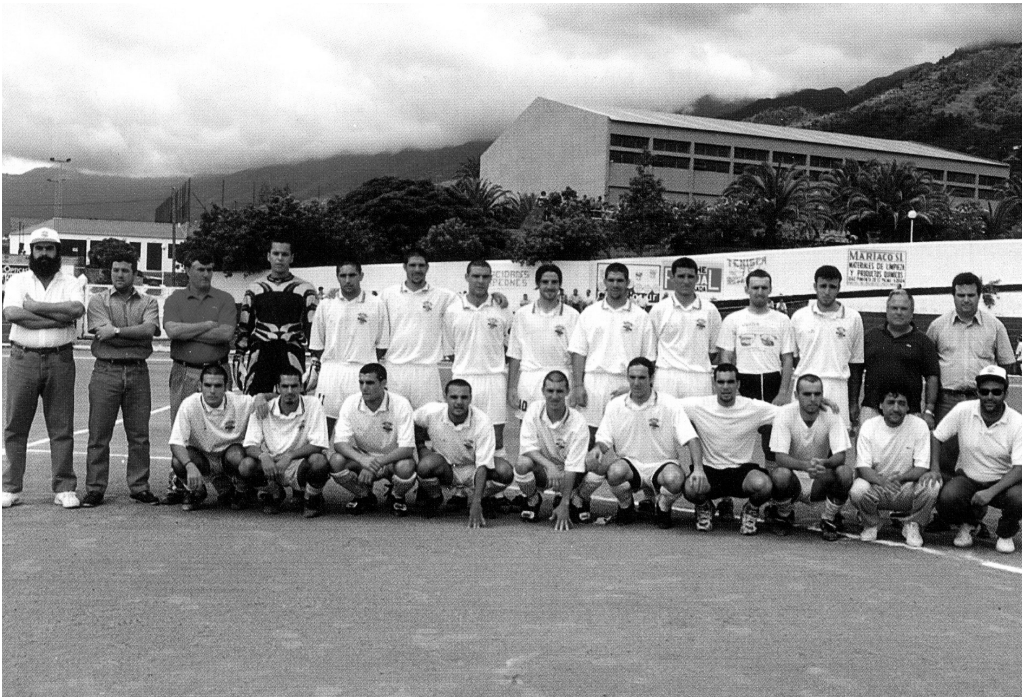
Formación del equipo que conquistó matemáticamente el campeonato de Liga de Tercera División frente al Artesano, temporada 1996-1997