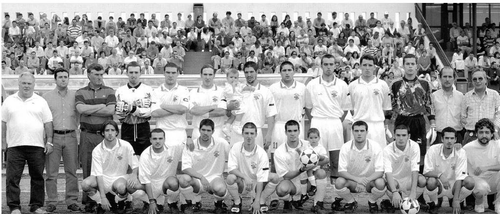
Plantilla de la S. D. Tenisca en un encuentro de la liguilla de ascenso a Segunda División B, temporada 1996-1997. Al fondo, las nuevas gradas del Estadio Insular de Miraflores completamente llenas