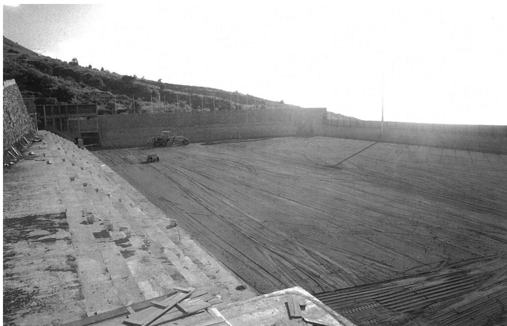
El Estadio Virgen de las Nieves en su última fase de construcción [MSB]