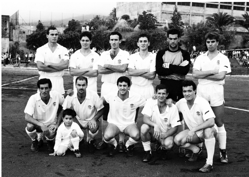
Once de la S. D. Tenisca en la temporada 1987-1988