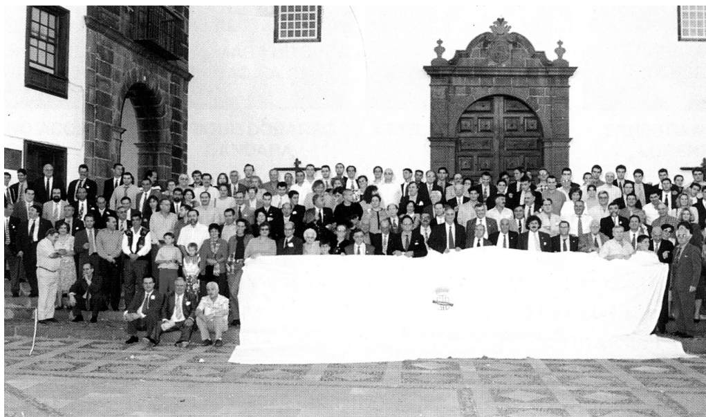
Fotografía general en las escalinatas de la plaza de San Francisco durante la conmemoración del 75º aniversario de la fundación del club, 1997 [SDT]