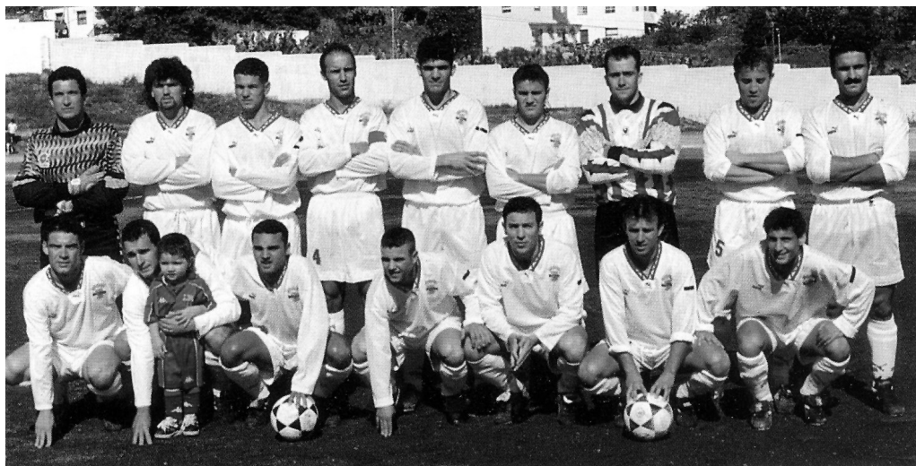
Formación de la S. D. Tenisca en la temporada 1992-1993