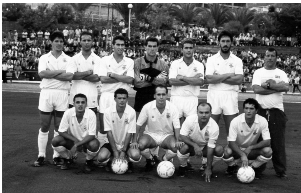
Once de la S. D. Tenisca a finales de los años ochenta en el Estadio Insular de Miraflores [SDT]