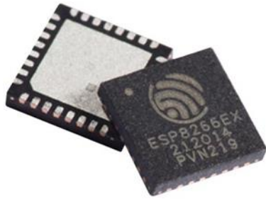
Figura 7 Microcontrolador ESP8266

ATMEGA4808: es un microcontrolador que presenta el procesador AVR® de 8 bits con multiplicador de hardware, que funciona hasta a 20 MHz y con hasta 48 KB de Flash, 6 KB de SRAM y 256 bytes de EEPROM en paquetes de 28 y 32 pines. La serie utiliza los últimos periféricos independientes centrales con características de bajo consumo, incluido un sistema de eventos, analógico inteligente y periféricos avanzados (Microchip, 2023).