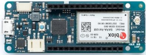
Figura 5 Arduino MKR NB 1500

Arduino MKR NB 1500: agrega comunicación de banda estrecha a sus proyectos. Puede comunicarse a través de redes NB-IoT y LTE-M, y es excelente para usar en proyectos de bajo consumo en áreas remotas. El MKR NB 1500 también es compatible con Arduino IoT Cloud, lo que facilita el acceso desde cualquier parte del mundo (Arduino, 2023).