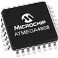
Figura 8 Microcontrolador ATMEGA4808

ATMEGA4808: es un microcontrolador que presenta el procesador AVR® de 8 bits con multiplicador de hardware, que funciona hasta a 20 MHz y con hasta 48 KB de Flash, 6 KB de SRAM y 256 bytes de EEPROM en paquetes de 28 y 32 pines. La serie utiliza los últimos periféricos independientes centrales con características de bajo consumo, incluido un sistema de eventos, analógico inteligente y periféricos avanzados (Microchip, 2023).