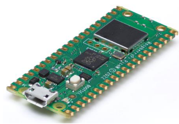
Figura 3 Raspberry Pi Pico W

Raspberry Pi Pico W: viene con un módulo totalmente certificado integrado con LAN inalámbrica 802.11n de 2,4 GHz, lo que la convierte en la solución perfecta para aplicaciones y proyectos de IoT que requieren comunicación inalámbrica (Raspberry Pi, 2023).