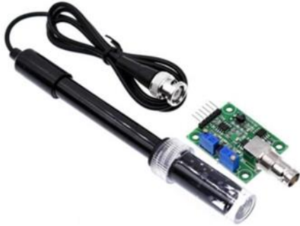
Figura 11 Módulo PH-4502C sensor de pH

PH-4502C: este sensor es un dispositivo que permite medir el pH ya que está integrado con una sonda que es la que toma la lectura mediante el conector BCN, su uso es muy eficiente en cultivos de hidroponía.