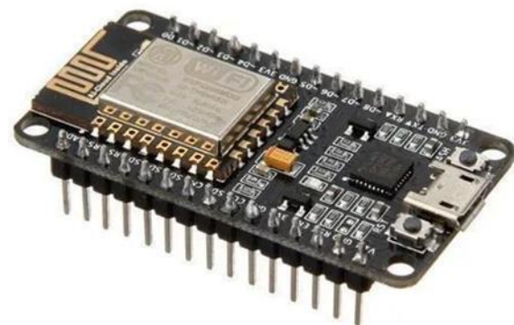
Figura 4 NodeMCU

NodeMCU: es una tarjeta con un microcontrolador ESP8266 que fue diseñado por una compañía china llamada Espressif Systems, viene con Wifi compatible con Arduino lista para usar en cualquier proyecto IoT (Cruz Vázquez, Velasco Pineda, & Ruiz Ruiz, 2021).