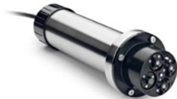
Figura 13 Sensor combinado para amonio y nitrato AN-ISE sc