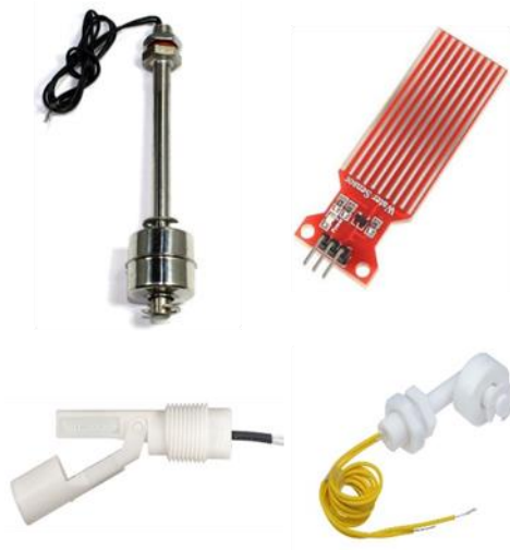
Figura 1 Diferentes modelos de sensores de nivel de agua

Los sensores de nivel pueden ser horizontales o verticales y se configuran de acuerdo al requerimiento del proyecto, también conocidos como "interruptor de nivel". Existen diferentes productos que trabajan como sensores o actuadores, combinados con boyas u otros mecanismos.