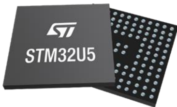
Figura 6 Microcontrolador STM32U5

STM32U5: incorpora características innovadoras y patentadas de ultra bajo consumo que reducen el consumo de energía típico de MCU en un 90 % en aplicaciones en las que los periféricos necesitan adquirir datos con regularidad. El MCU STM32U5 también proporciona funciones de seguridad adicionales para la resistencia a ataques físicos y se basa en la arquitectura probada TrustZone® de Arm que garantiza un aislamiento adicional para los recursos críticos para la seguridad (STMicroelectronics, 2023).