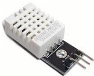
Figura 9 Sensor de humedad relativa y temperatura DHT22

DHT22: es un sensor digital de temperatura y humedad, a diferencia del 18b20 este no sirve para medir la temperatura de líquidos sino más bien para medir el aire, es de bajo costo y además para Arduino IDE.