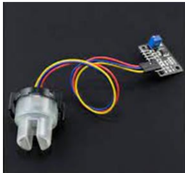
Figura 12 Sensor de turbidez de agua SEN0189

SEN0189: permite medir de forma sencilla la calidad de agua midiendo la turbidez del agua. Integra un diodo infrarrojo y un fototransistor posicionados uno frente al otro, que permiten medir la dispersión y transmitancia de la luz y con esto detectar las diferentes partículas suspendidas en el agua o TSS (Total Suspended Solids).