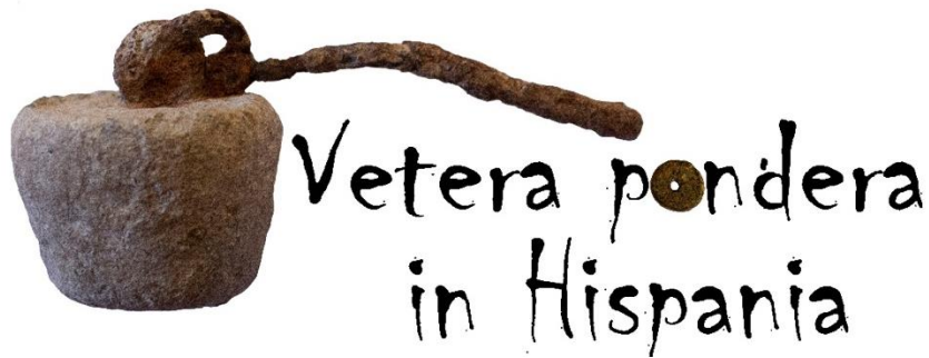
Fig.- 1. Logo diseñado para el Proyecto Vetera pondera in Hispania .