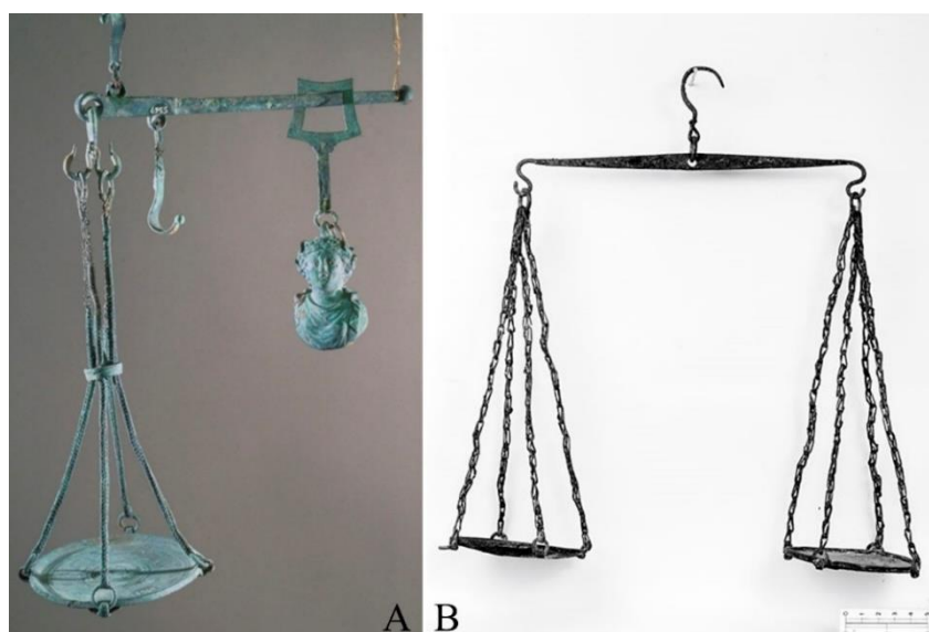
Fig.-2. Balanzas procedentes de Pompeya: A) Statera , depositada en el Museo Archeologico Nazionale di Napoli n.º inv. 5569 (según http://digilib.mpiwg-berlin.mpg.de/digitalibrary/jquery/digilib.html?fn=permanent/mpiwg/website/features/FS32_img_large.jpg ; B) libra , depositada en el Wellcome Historical Medical Museum of London (según https://commons.wikimedia.org/wiki/File:Roman_bronze_balance_excavated_at_Pompei_Wellcome_M0014276.jpg )

La balanza de dos platillos (Fig. 2B) permitía establecer la comparación entre una materia y un objeto que representa un valor ponderal correspondiente bien a la unidad o a sus fracciones o múltiplos. Estas piezas se conforman a partir de una barra, generalmente cilíndrica y dispuesta horizontalmente ( scopus ), en cuyo punto medio se sitúa un fiel ( iugum ). Este último elemento, colocado en posición vertical, distribuye la barra en dos secciones o brazos de idénticas dimensiones, de cuyos extremos cuelgan dos platillos que se suelen sujetar mediante cadenas. Cabe destacar que los primeros ejemplares de este tipo de instrumentos ponderales han sido documentados ya en la primera mitad del III milenio a. C.