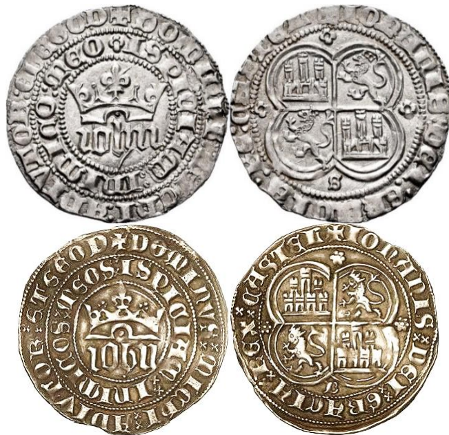
Fig. 4: Real de plata de Juan I, de las cecas de Sevilla y Burgos, respectivamente (Catálogo Imperatrix correspondiente al rey Juan I, tipo 1) 14