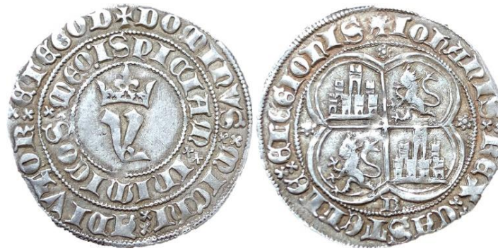
J1:1.2: Burgos, Marca "B". Peso: 3,41. Diámetro: 28. Rareza: 9. Museo Arqueológico Nacional, Ref. Inv. 1994/50/7844.

A/ Id. J1:1.1. Leyenda: el lema exterior termina en "D", y el interior en "MEO:", si bien, este último, comienza a las 11h.