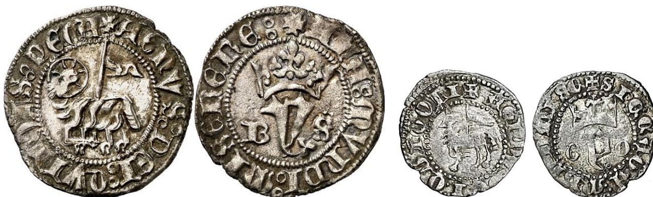
Fig. 2: Blanco y Medio Blanco del Agnus Dei de Juan I (Catálogo Imperatrix correspondiente al rey Juan I, tipos 8 y 10) 9

Jl:1 a Jl:2 ), tal y como ya habían hecho sus antecesores Pedro I - entre octubre de 1363 y abril de 1366- y Enrique II -entre octubre de 1373 y mayo de 1379- (Véase Fig. 3).