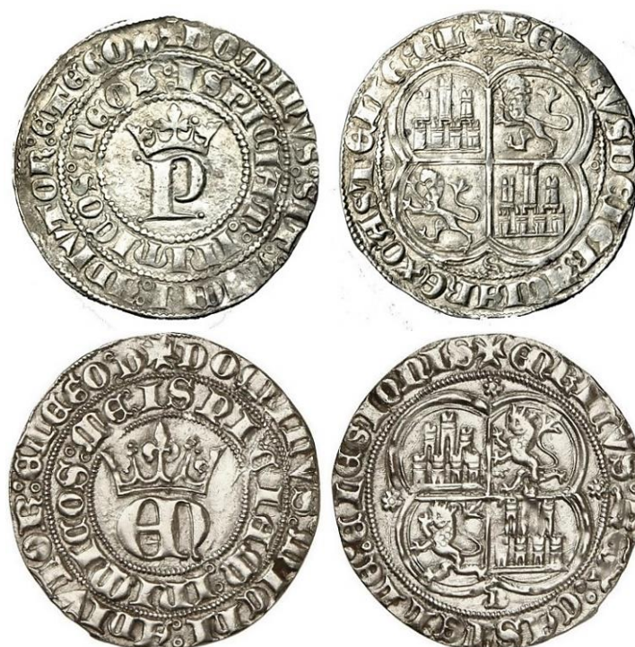
Fig. 3: Reales de plata de Pedro I y de Enrique II, de las cecas de Sevilla y Burgos, respectivamente (Catálogo Imperatrix correspondiente al rey Pedro I y Enrique II, tipos 12 y 22 respectivamente) 10