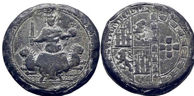
Fig. 1: Sello plúmbeo de Juan I, titulándose al final del lema del reverso "Rex Castellae et Portugalie"

De hecho, su política a partir de aquel calamitoso evento tendió más a hacerle conservar lo propio dentro del reino, que ha extender sus fronteras más allá de la "raya lusa". A ello, contribuyó en gran medida la acometida final protagonizada por el duque de Lancaster, encaminada -no sin cierta razón- a hacer valer los derechos dinásticos que recaían en su esposa, doña Constanza de Castilla -hija de Pedro I-, y verdadera legítima heredera de la corona de Castilla y León.