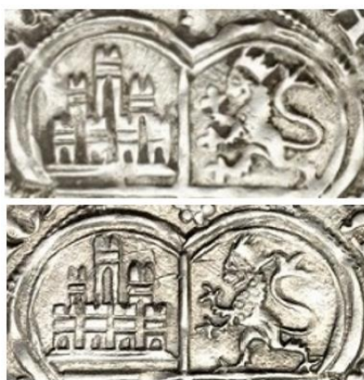
Fig. 5: Comparativa de un real burgalés de la primera emisión de “Iohn” (arriba), con respecto a otro de la segunda emisión de “Y” (abajo)

Realmente se hace difícil determinar si estas escasísimas labras argénteas fueron acuñadas al comienzo del reinado de Juan I -como proponía Beltrán-; o al final del mismo -como es de generalizada opinión en la actualidad-. Es bien cierto que un dato a favor de la primera propuesta es la gran similitud que encontramos en el dibujo de los castillos y leones del cuartelado “de honor” del reverso con respecto de los reales burgaleses de la primera emisión (Véase Fig. 4, para Burgos), con respecto a los de esta segunda tirada (Véase JI:1.1 a JI:3). Si nos fijamos bien, ambos fueron abiertos en cuño por una misma mano de maestro, o, si acaso, por algún aprendiz muy cercano a los conocimientos técnicos y artísticos de dicho abridor, aunque tal acción se produjese -o quizás no- en momentos idénticos o dispares en el tiempo (Véase Comparativa entre ambas emisiones (Véase Fig. 5).