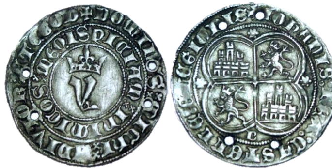
J1:1.3: Burgos, Marca "B". Peso: 3,34. Diámetro: 27,8. Rareza: 9. Antigua Col. Gerardo Flores Martín (Madrid).

R/ Id. J1:1.1. Leones de estilo diferente, idénticos a los utilizados para el entalle de los sextos de real. Leyenda: finaliza "LEGIONIS", con separación de dobles aspas.